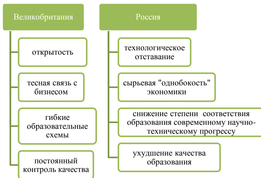
Рисунок 3. Сравнительные принципы оказания образовательных услуг на международном рынке (составлено авторами)

В течение последнего десятилетия в ней стал в три раза больше прием зарубежных обучающихся, чему способствовало то, что Британское образование основывается на следующих параметрах по сравнению с Российскими, рисунок 3.