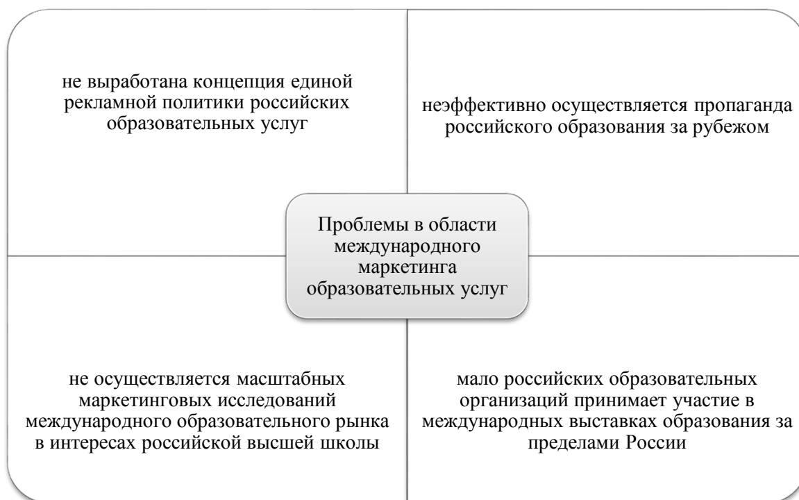
Рисунок 1. Проблемы оказания «образовательной услуги» в контексте экспорта образования (составлено авторами)

Подтверждая проблематику, рассмотренную на рисунке 1, в своем исследовании И.И. Дьяков с соавторами отмечают, что «недостаточная разработанность методологии оценки делает невозможным принятие эффективных, научно-обоснованных решений по формированию и развитию маркетинговой составляющей деятельности организаций высшего образования» [5, с. 208].