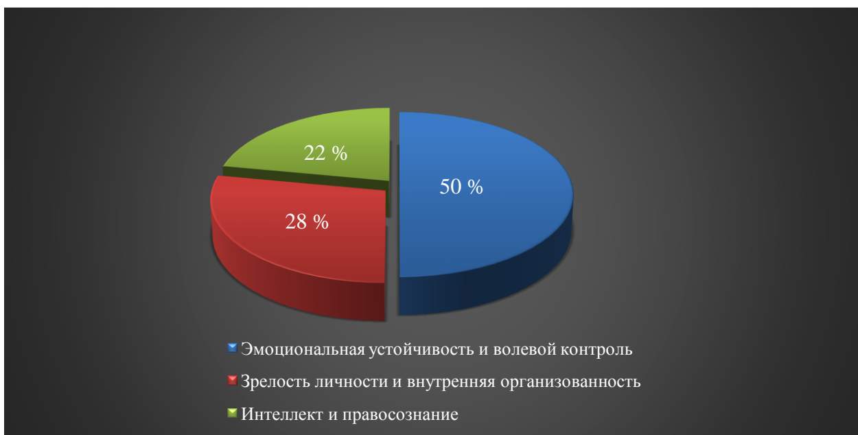
Рисунок 3. Факторная структура, способствующая формированию эмоционального выгорания сотрудников полиции (составлено авторами)

Данная структура личностных особенностей, предопределяющих формирование синдрома эмоционального выгорания сотрудников полиции, положена в основу психолого-педагогической программы его преодоления, разработанной в рамках формирующего этапа исследования.