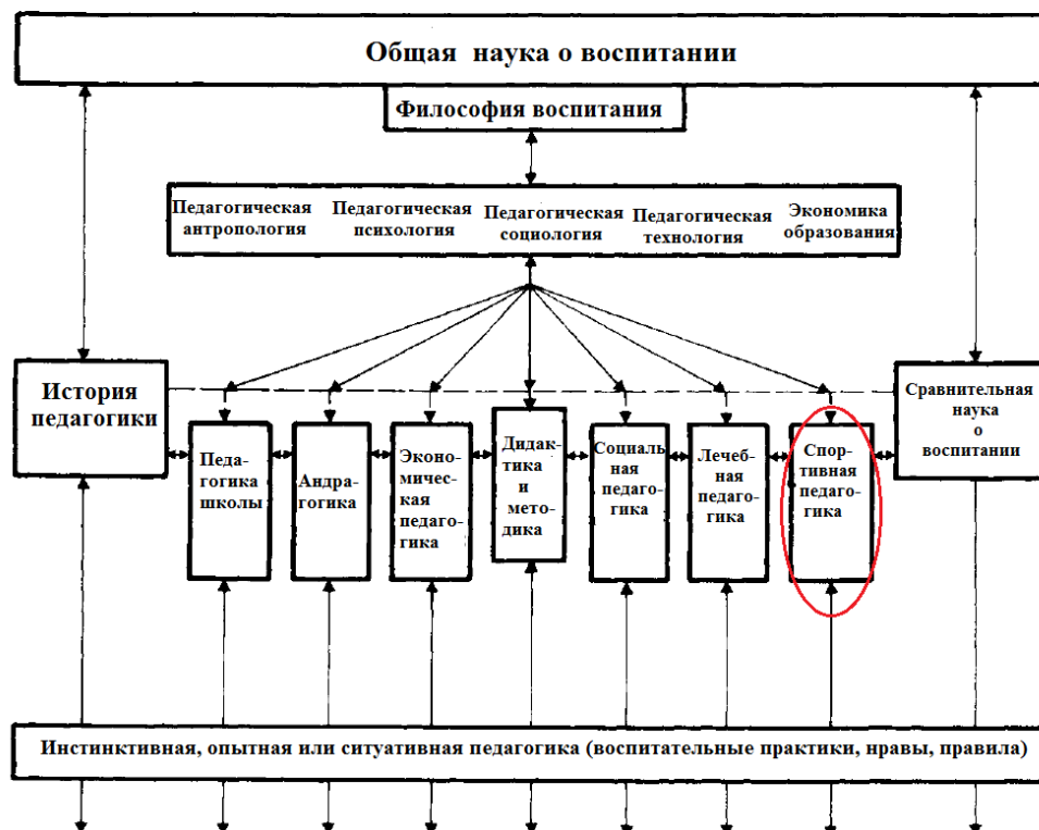
Рисунок 3. Наука о воспитании и ее исследовательские области [11, с. 74] (схема дополнена переводом - авт.)

Как наглядно показано на рисунке, шесть важнейших сфер педагогической практики, проявляющиеся в воспитательной действительности, расположены на пересечении трех плоскостей, символизирующих возможный модус их рассмотрения - исторический, дидактико-методический и сравнительный (компаративный), каждый из которых может доминировать или быть учтен при анализе отдельных педагогически значимых феноменов или процессов. Данный подход явился исходным при конструировании Г. Рёрсом системы и структурных компонентов науки о воспитании (рисунок 3).