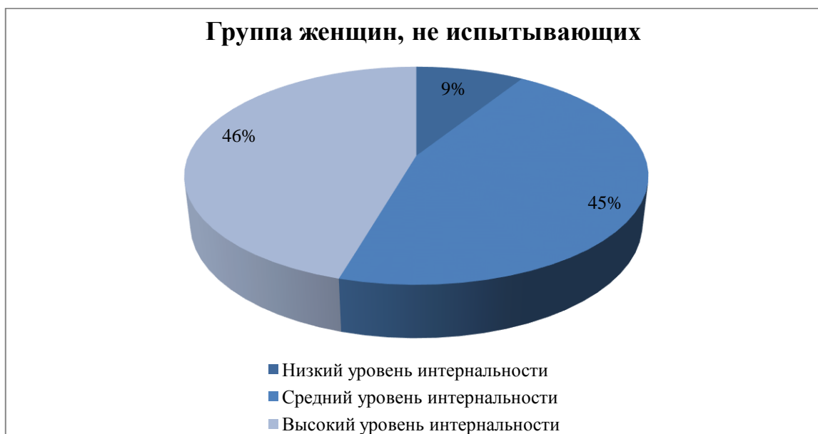
Рисунок 4. Результаты исследования локус контроля у женщин, не имеющих опыт проявления насилия в отношениях (рисунок авторов)