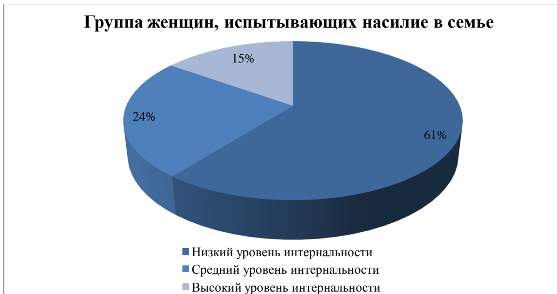
Рисунок 3. Результаты исследования локус контроля у женщин, имеющих опыт проявления насилия наркозависимого супруга (рисунок авторов)

Полученные результаты дают нам право говорить о том, что у данной группы женщин наиболее часто встречаемым является экстернальный локус контроля, это указывает на то, что 60,6 % процентов респондентов из исследуемой выборки не отслеживают связь между своими различными жизненными ситуациями и своими действиями. Они нацелены думать, что все, что происходит с ними и их жизнью является результатом чужого воздействия и влияния.