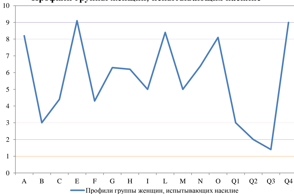
Рисунок 1. Результаты исследования индивидуально-психологических особенностей личности у женщин, имеющих опыт проявления насилия наркозависимого супруга (рисунок авторов)

Стоит отметить, что факторы С (Хср. = 4,4); F (Хср. = 4,3); G (Хср. = 6,3); H (Хср. = 6,2); I (Хср. = 5); M (Хср. = 5); N (Хср. = 6,4) – не выражены, то есть по этим личностным качествам данные женщины не отличаются от остальной популяции.