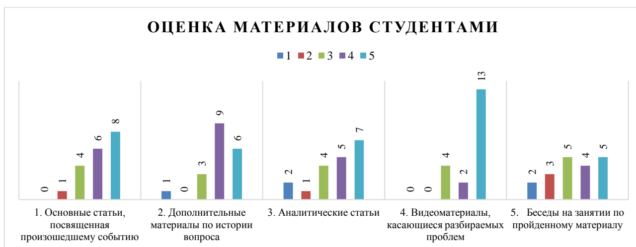
Рисунок 3. Результаты опроса студентов (составлено авторами)