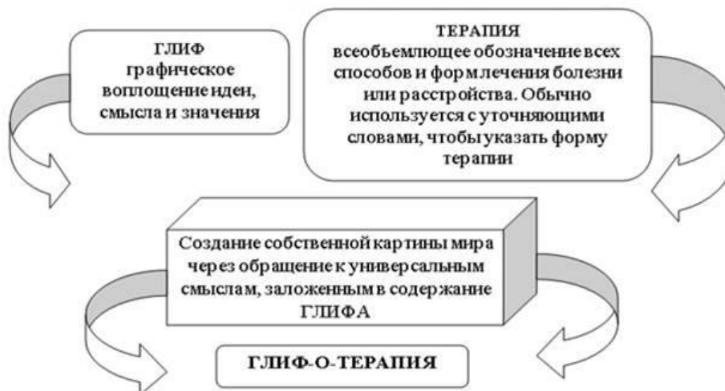
Рисунок 3. Этимолого-логическая цепочка построения термина «глифотерапия». Денотативное и коннотативное значение термина «глифотерапия» (составлено авторами)

Исходя из вышеизложенного, обоснование термина «глифотерапия» представлено на рисунке 3.