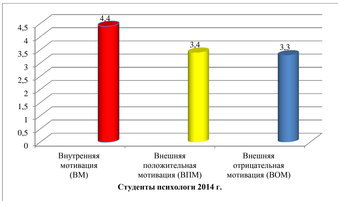
Рисунок 2. Результаты психодиагностики мотивации профессиональной деятельности студентов-психологов гуманитарного факультета НФ МГЭИ набора 2014 г. (рис. авторов)

Психодиагностический комплекс профессиональной сферы студентов-психологов набора 2014 года включал в себя следующие составляющие: методику «Мотивация профессиональной деятельности» (К. Замфир в модификации А.А. Реана) и опросник «Якоря карьеры». Выявленные нами результаты показаны на рисунках 2 и 3.