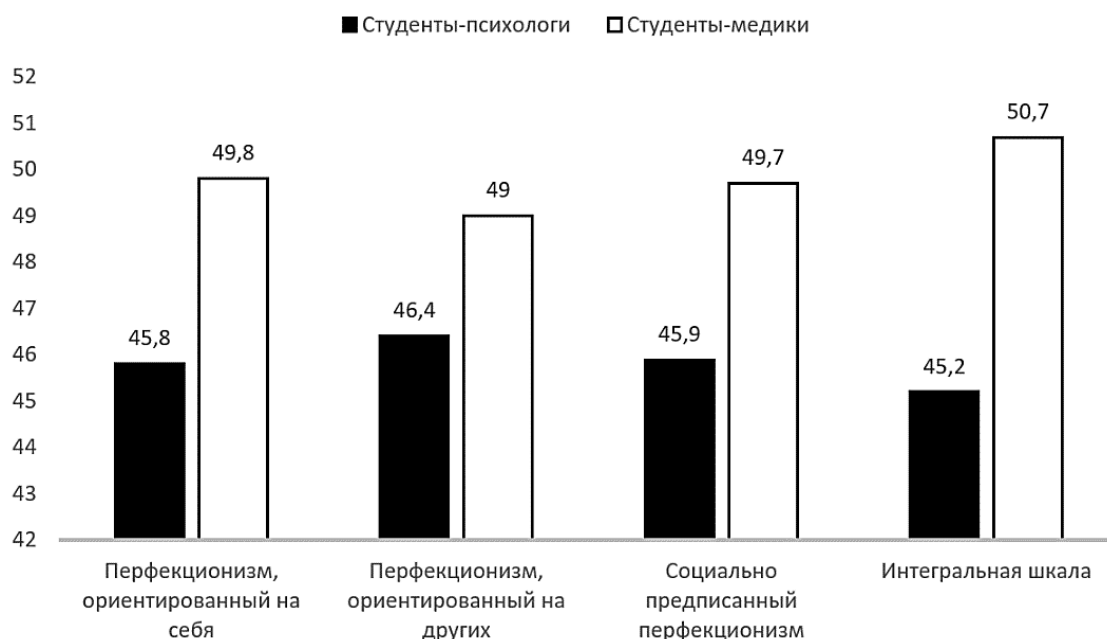
Рисунок 3. Соотношение средних рангов по шкалам опросника «Многомерная шкала перфекционизма» П. Хьюитта и Г. Флетта (составлено автором)

Обработка данных по критерию Манна-Уитни не выявила значимых различий по шкалам перфекционизма.