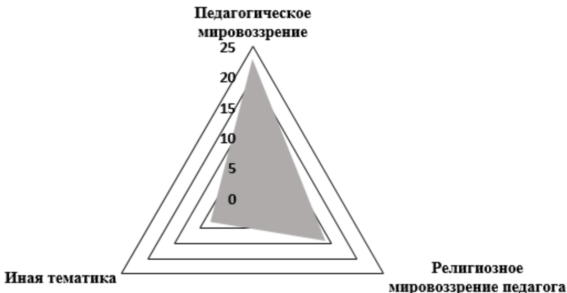
Рисунок 2. Распределение публикаций в ресурсе Web of Science по тематическим кластерам

Распределение публикаций показывает, что, с определенной долей условности, можно выделить три тематических кластера, которые представлены на рисунке 2.