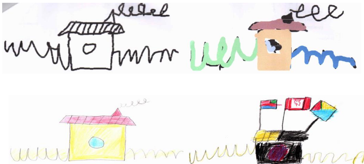
Рисунок 2. Пример работы учеников в рамках психодиагностического тестирования методике «Домик» Гуткиной Н.И., дополненного раскрашиванием по методикам Люшера М., Бака Дж. и Берни Г.) (компьютерная и бланковая версии) (разработано автором Рамазановой Е.А. на основе данных методик психодиагностики Гуткиной Н.И., Люшера М., Бака Дж. и Берни Г.)

Ранее, в одной из наших предыдущих статей, мы обратили внимание читателя на отличие в анализе рисунка учащегося, выполненного на экране компьютера. Мы отметили, что рисовать на экране компьютера детям сложнее, чем карандашом. Возможна асимметрия рисунка. По этой причине неточности в изображении нами не учитывались. Но мы принимали во внимание направление линий, форму элементов (закругленные, заостренные и т. д.), количество элементов. При рисовании с помощью компьютерной мыши учащиеся выполняют рисунки в центре экрана. Именно поэтому положение рисунка на экране не учитывается [10].