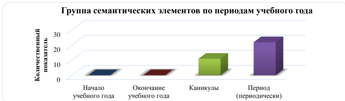
Рисунок 3. Группа семантических элементов по периодам учебного года

(периодически)» (контент-показатель - 22) и «Каникулы» (контент-показатель - 11) (см. рисунок 3 (рисунок автора)).