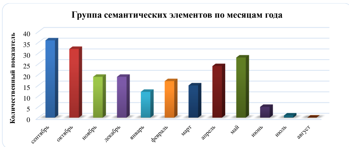
Рисунок 5. Группа семантических элементов по месяцам года

Приоритетные единицы группы семантических элементов по месяцам года: «Сентябрь» (контент-показатель - 36), «Октябрь» (контент-показатель - 32), «Апрель» (контент-показатель - 24), «Май» (контент-показатель - 28) (см. рисунок 5 (рисунок автора)).