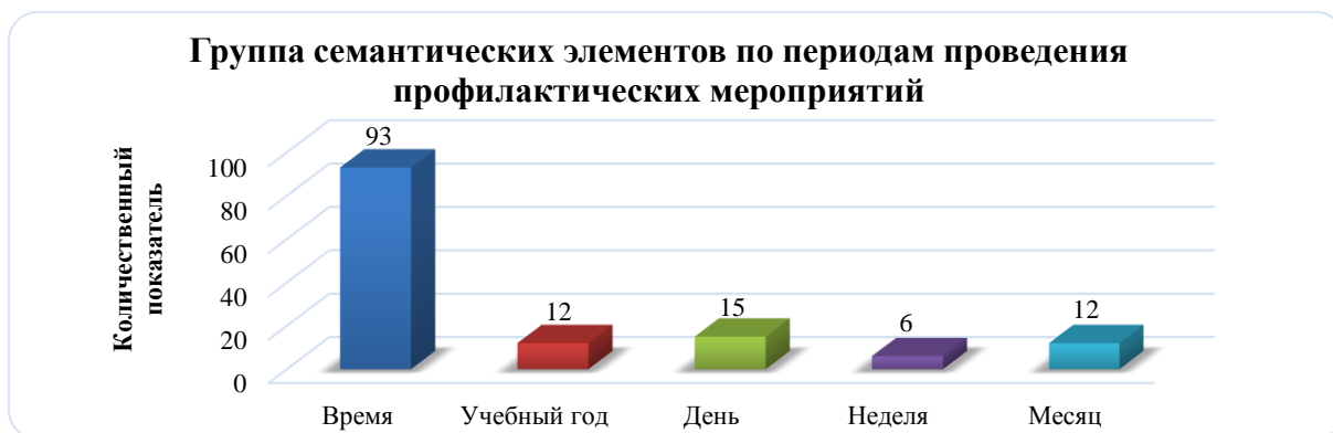
Рисунок 4. Группа семантических элементов по периодам проведения профилактических мероприятий

В группе семантических элементов по периодам проведения профилактических мероприятий приоритетные единицы, наряду с единицей «Время» (контент-показатель - 93), стали «День» (контент-показатель - 15), «Учебный год» (контент-показатель - 12), и «Месяц» (контент-показатель - 12) (см. рисунок 4 (рисунок автора)).