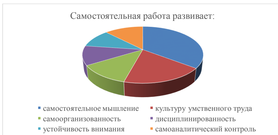
Рисунок 1. Способности, развивающиеся при выполнении самостоятельной работы по иностранному языку (составлено автором)

Затем был проведено анкетирование студентов 1–2 курсов 11 института «Материаловедения и технологий материалов» (всего 84 респондента). Цель анкеты состояла в том, чтобы выяснить, какие способности они могут развить при выполнении самостоятельной работы на иностранном языке. По мнению студентов, самостоятельная работа развивает (рисунок 1): самостоятельное мышление – 35,4 %; культура умственного труда – 18,8 %; самоорганизованность – 12 %, дисциплинированность – 11 %; устойчивость внимания – 10,5 %; самоаналитический контроль – 12,3 %.