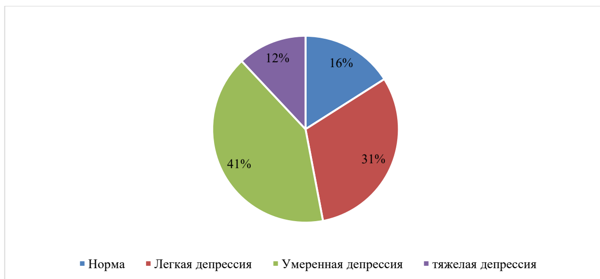
Рисунок 1. Оценка степени выраженности депрессии у педагогов (составлено авторами по материалам исследования)

С целью изучения уровня депрессии у педагогов и особенностей их психоэмоционального состояния использовалась шкала депрессии А.Т. Бека, данные представлены на рисунке 1.