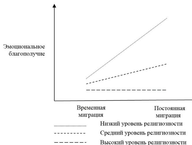
Рисунок 1. Характер влияния типа миграции и уровня религиозности на эмоциональное благополучие

2. Графики (рис. 1, рис. 2, рис. 3) показывают характер влияния типа миграции и уровня религиозности на эмоциональное благополучие, и форматы самооценки.