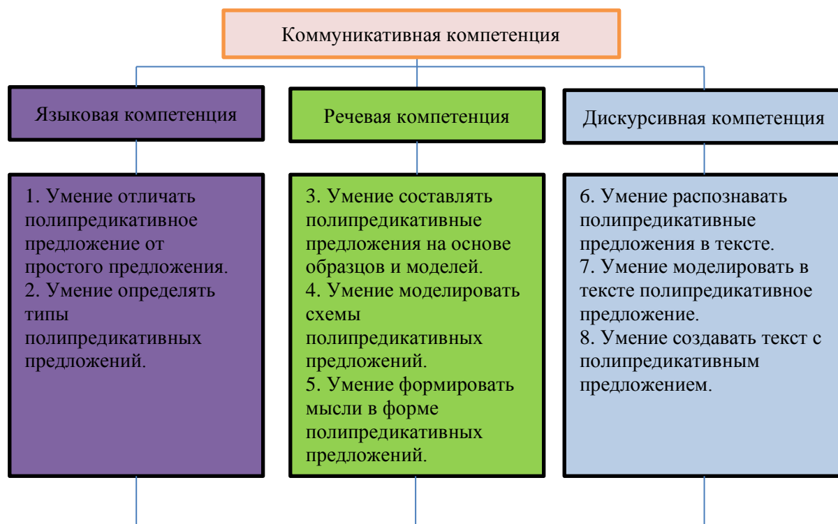
Рисунок 1. Структура и состав коммуникативной компетенции, формируемая в процессе обучения полипредикативным предложениям в 4 классе якутской школы (составлена авторами)

Лингвистические понятия, которые школьники будут осваивать в ходе изучения полипредикативных предложений, имеют большее значение, чем обычное понимание «грамматизации» содержания учебного предмета по родному языку. Во-первых, лингвистические понятия служат познавательным инструментом освоения родного языка на сознательном уровне. Язык – это система знаков, речь – язык в действии, языковая норма осваивается только на основе сознательного усвоения лингвистических понятий, грамматических правил, позволяющих обратить внимание на свою речь. В этом плане полипредикативные модели предложений используются в качестве способов обучения разграничивать понятие предложения как языковую единицу и его содержательного смысла как речевую единицу, элементарным приёмам семантического анализа предложений и показать роль полипредикативных синтаксических конструкций в создании текстов. Во-вторых, полипредикативные предложения способствуют формированию умений обобщать ситуации, события и действия. Как отмечает Б.Ю. Норман, «синтаксические модели закономерно отражают объективную действительность», «именно возможности синтаксиса подсказывают нам, как «увидеть» ситуацию, помогают понять, что она, собственно, собой представляет», «синтаксис, образно говоря, – это рельсы, по которым движется поезд познания» [9, с. 38–57].