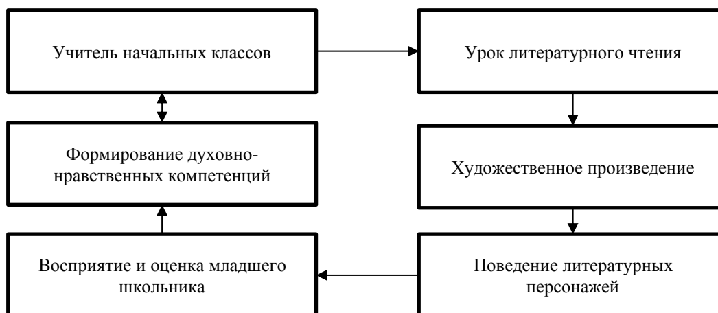
Рисунок 1. Модель формирования у младшего школьника духовно-нравственных компетенций средствами литературного чтения (составлено авторами)

Необходимо построить исследование произведения таким образом, чтобы оно «касалось» души читателя, чтобы идея была не только доступна и понятна, осознана читателем, но и пережита им. Ребенок младшего школьного возраста в процессе эмоционально-оценочной деятельности при изучении произведения высказывает собственное мнение и воспринимает чужое.