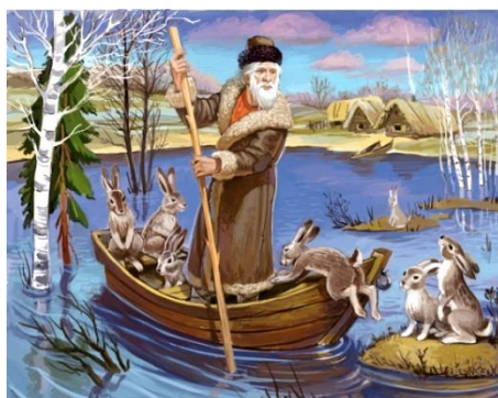
Рисунок 3. Рисунок к стихотворению Н.А. Некрасова «Дедушка Мазай и зайцы» https://u.livelib.ru/reader/boservas/o/kk7x9a7s/414-o.jpeg

В данном художественном произведении автором заложен глубокий человеческий смысл. Используя стихотворение Н.А. Некрасова «Дедушка Мазай и зайцы» (рис. 3) на уроках литературного чтения, педагог решает важные педагогические задачи в области формирования духовно-нравственных компетенций младших школьников.