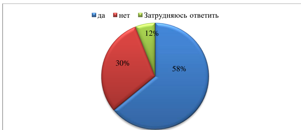
Рисунок 3. Результаты опроса «Представляет ли в настоящее время идеология терроризма и насильственного экстремизма реальную угрозу для государства и российского общества?»

Таким образом, можно сделать следующий вывод о том, что, являясь основным источником освещения проблематики терроризма и оказания информационно-психологического воздействия, средства массовой информации несут потенциальную угрозу, так как качество (содержание) подаваемой информации не всегда является достоверным, а молодежь в силу своих возрастных особенностей склонна воспринимать информацию некритически.