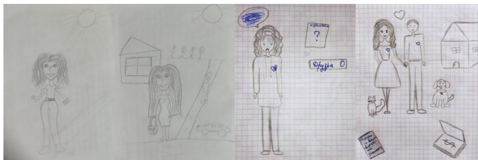
Рисунок 3. Примеры рисунков третьей группы респондентов

Во вторую группу (36 респондентов) вошли испытуемые, рисунки которых были обозначены концептами «что-то другое», «противоположное», «противоречие», «изменение», «достижение идеала», «противопоставление», «Золушка и Принцесса» и т. п. Концепт второй группы был обозначен как «изменение себя» и представлен на рисунке 2.