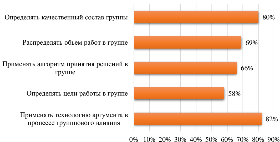
Рисунок 2. Результаты рефлексии слушателей по освоению модуля «Управление персоналом организации»

Мониторинг освоения данного модуля осуществляется на базе LMS Moodle, где представлена опрос-анкета «Рефлексия освоения данного модуля», на базе GoogleApps. Данный электронный ресурс позволяет очень быстро получать информацию слушателей об отношении к прохождению данного модуля. На вопрос анкеты «Чему я научился во время прохождения данного модуля», слушатели указали освоение следующих навыков, которые показаны на рисунке – 2.