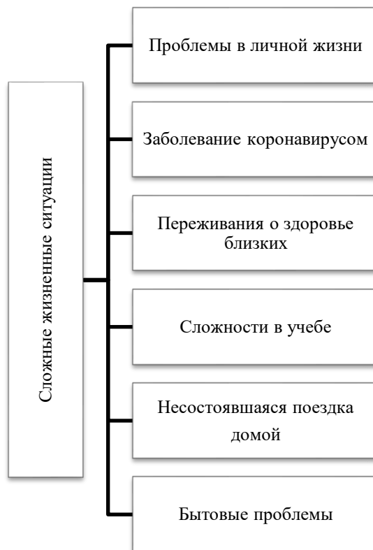
Рисунок 1. Сложные жизненные ситуации для образовательных мигрантов (составлено авторами по результатам авторского опросника)

Для изучения сложных жизненных ситуаций, с которыми сталкиваются образовательные мигранты, методом фокус-групп были выделены наиболее повторяющиеся сложные ситуации, с которыми студенты сталкивались в течении прошедшего года (включая условия социальной изоляции в период пандемии Covid-19). В конечный вариант авторского опросника были включены ситуации, представленные на рисунке 1.