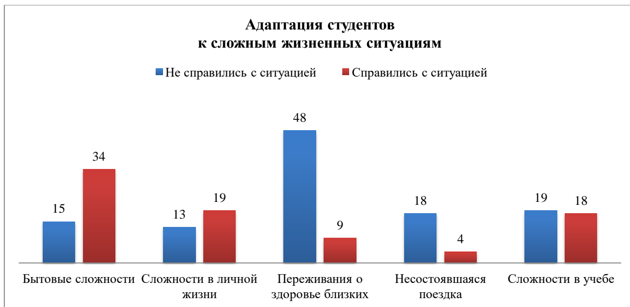
Рисунок 4. Показатели адаптации к сложным жизненным ситуациям в группе образовательных мигрантов из Ростова-на-Дону (составлено авторами)

Рассмотрим общие результаты по позитивно и негативно преодолевшим сложные жизненные ситуации среди образовательных мигрантов из Ростова-на-Дону на рисунке 4.