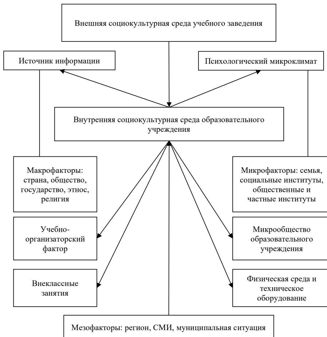
Рисунок 1. Модель социокультурной среды инклюзии современного образовательного учреждения (разработано авторами)

Модель социокультурной среды включения современного образовательного учреждения включает в себя внешние и внутренние факторы, оказывающие непосредственное влияние на ее компоненты, входные и выходные потоки (рис. 1).