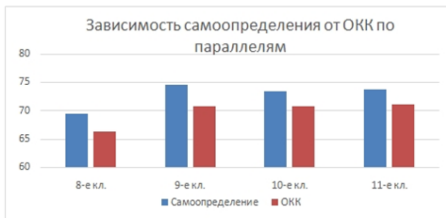
Рисунок 3. Зависимость самоопределения от ОКК на декабрь 2017 года (составлена авторским коллективом)

Дальнейшее исследование было направлено на раскрытие выявления факторов, на которые оказывают влияние общекультурные компетенции. Мы теоретически обосновали, что ОКК оказывают влияние на ценностные ориентации школьника и приёмы его личностной саморегуляции.