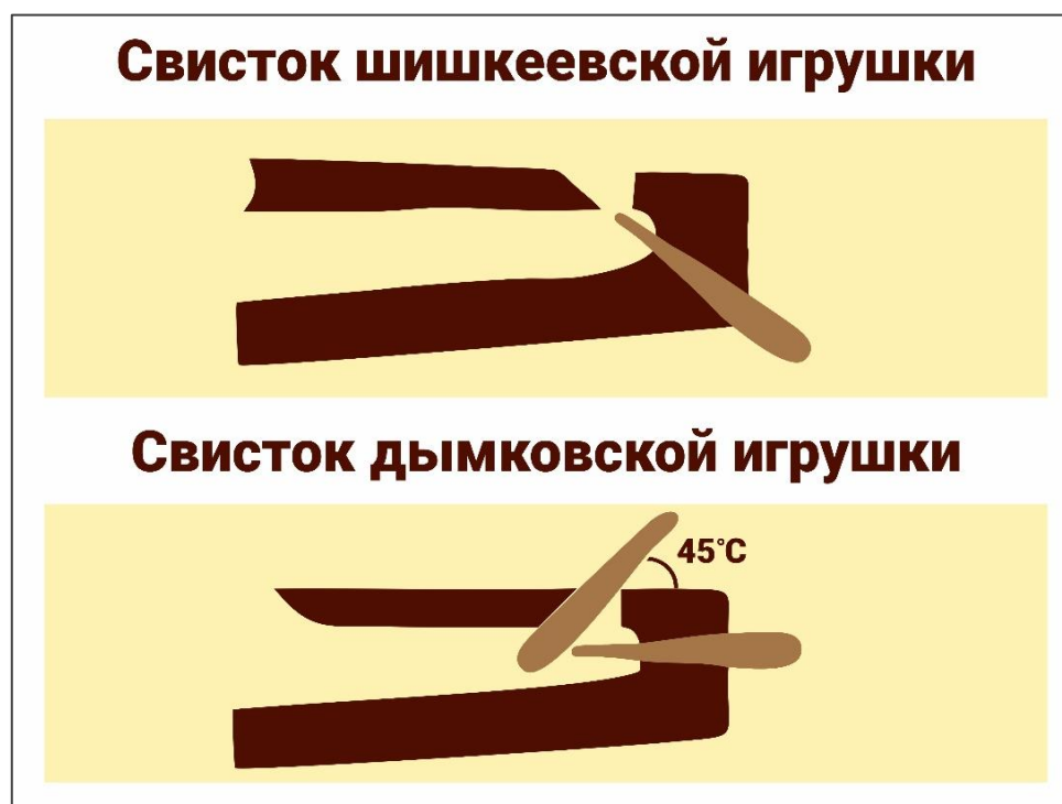
Рисунок 3. Схема свистков дымковской и шишкеевской глиняной игрушки (разработано авторами)

В процессе лепки дети познакомились с ещё одной характерной особенностью шишкеевской игрушки – технологией изготовления свистка. Учащиеся познакомились со схемами свистков дымковской и шишкеевской глиняной игрушки и, методом сравнения, поняли базовые принципы технологий (рисунок 3).