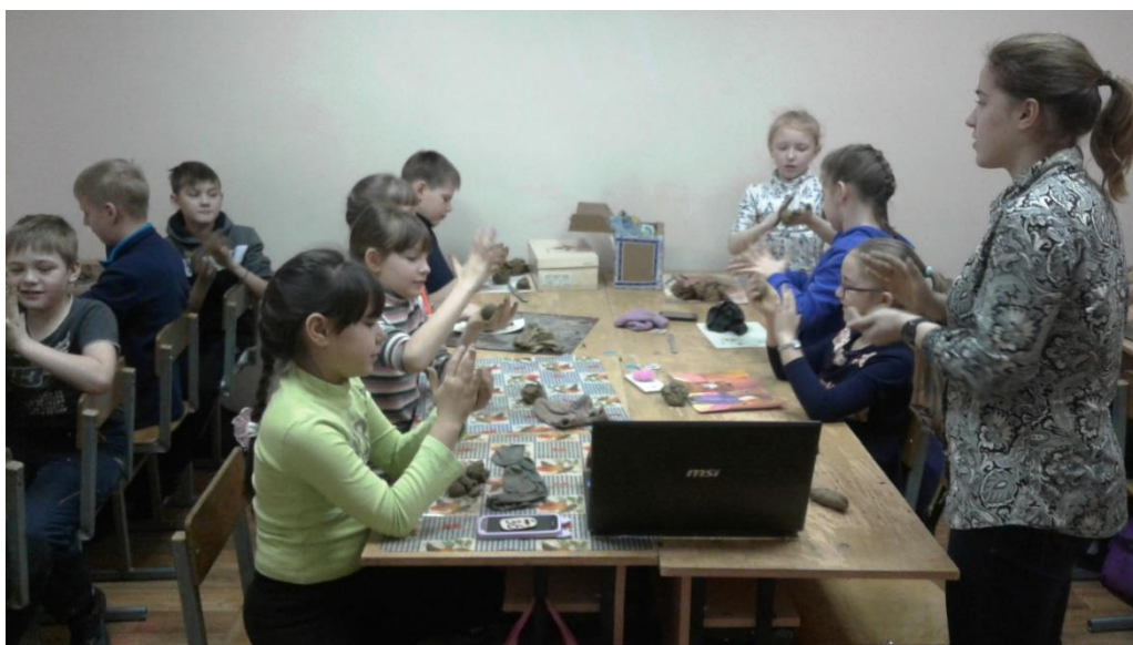
Рисунок 4. Процесс создания творческой работы по мотивам шишкеевской глиняной игрушки

В ходе исследования проведена диагностика творческого мышления по тесту Е. Торренса с целью выявления уровня развития творческого мышления на конечный результат выполненной игрушки. По результатам теста, средние показатели уровня креативности оказались довольно высокими. Было выявлено, что дети с более низкими результатами выполнили игрушку по образцу без творческих элементов. А дети с более высокими показателями (60 %) проявили в работе больше воображения, их игрушки были более креативными, аккуратными и дополнены интересным декором. Работы отличались в основном уровнем разработанности и оригинальности. Это подтверждает эффективность проведенных занятий и возможность использования такой формы работы в различных организациях дополнительного образования.