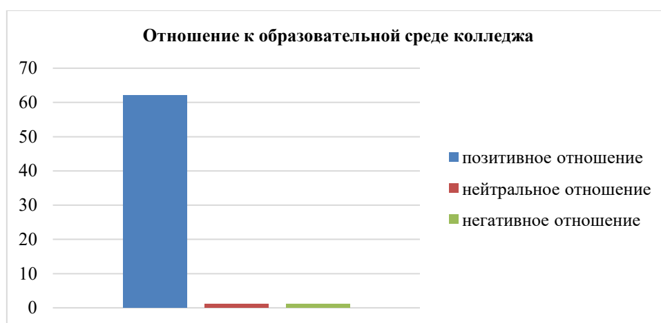
Рисунок 1. Отношение (когнитивный компонент) студентов к образовательной среде университетского колледжа (составлено автором)

По эмоциональному компоненту были получены следующие результаты (рис. 2):