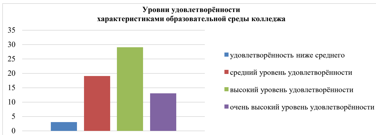
Рисунок 4. Уровни удовлетворённости студентов характеристиками образовательной среды университетского колледжа (составлено автором)