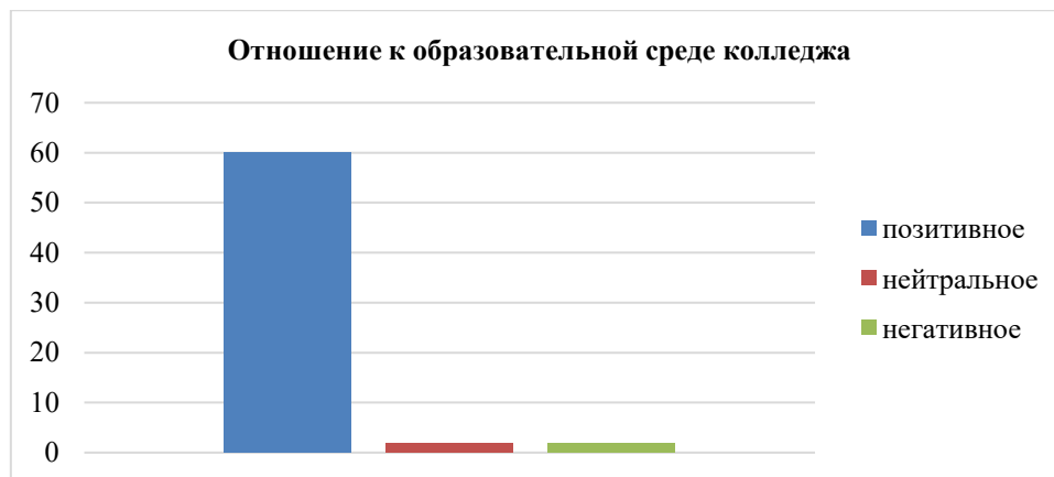
Рисунок 3. Отношение (поведенческий компонент) студентов к образовательной среде университетского колледжа (составлено автором)

Результаты диагностики свидетельствуют о том, что у подавляющего большинства студентов колледжа позитивное отношение к образовательной среде по всем трём компонентам: когнитивному (наличие представлений о том, что колледж развивает профессиональное мастерство, жизненные умения и навыки, способствует интеллектуальному развитию), эмоциональному (эмоциональное отношение к своей образовательной деятельности и учебному процессу), поведенческому (способность управлять своим поведением).