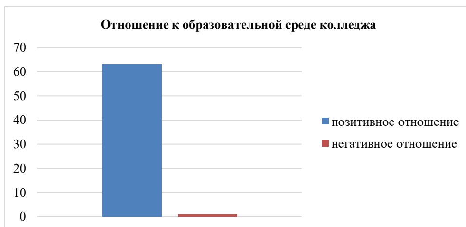
Рисунок 2. Отношение (эмоциональный компонент) студентов к образовательной среде университетского колледжа (составлено автором)