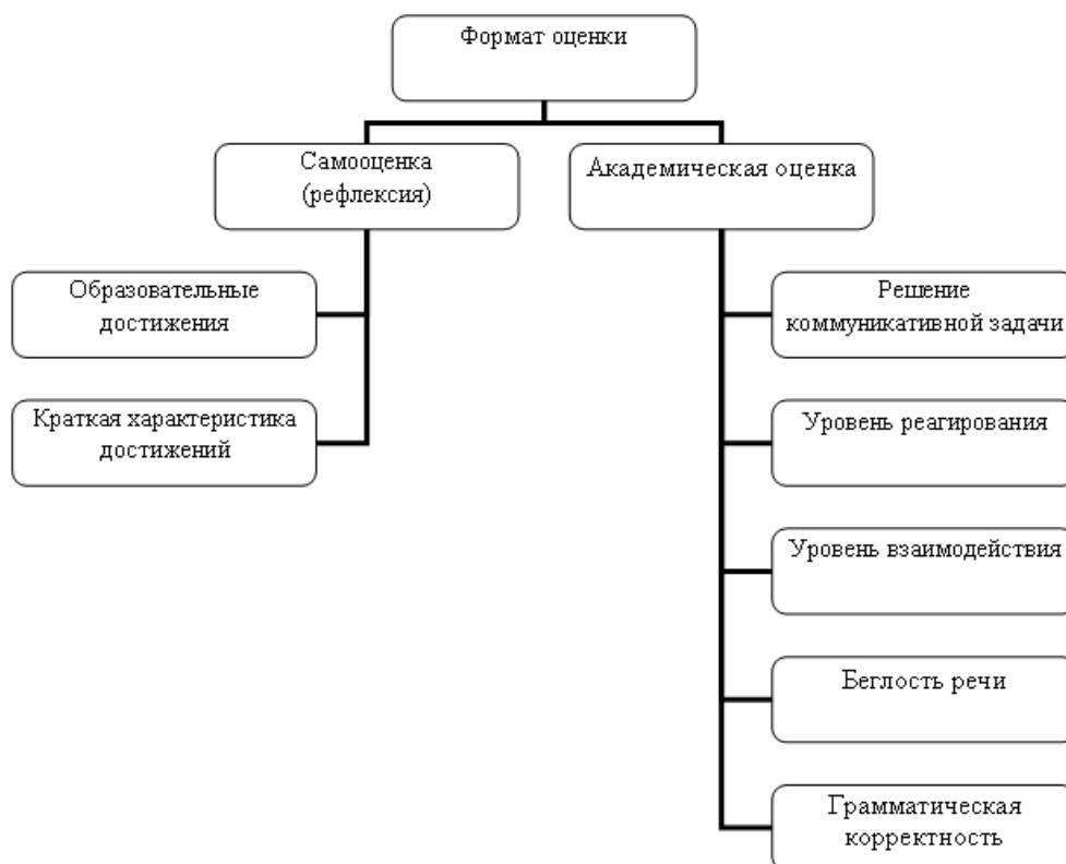
Рисунок 1. Формат результатов оценки эффективности (составлено автором)

Результаты занятий по английскому языку по основной программе ФГОС ВПО Иностранный язык были оценены с помощью листа самооценки самими студентами, а также при помощи «листа успешности». Взаимосвязь показателей представим на рисунке 1.