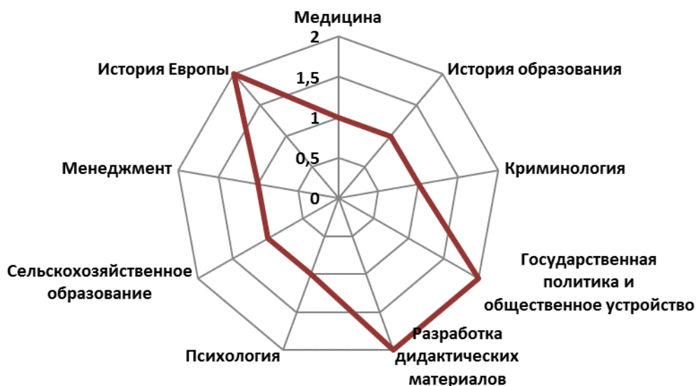
Рисунок 3. Тематическое распределение британских исследований в 90-е годы XX века (составлено авторами по данным ProQuest, http://www.proquest.com/products-services/pqdtglobal.html )

По сравнению с тематикой, представленной в восьмидесятые годы, обращает на себя внимание увеличение количества кластеров, в рамках которых представлены проблемы неформального образования. В частности, в рамках новой позиции «Государственная политика и общественное управление» появляются диссертации о значении неформального образования для развития общественных и политических отношений; появляются новые тематические кластеры «Менеджмент», «Медицина». Также сохраняется тематика, ранее представленная в тематических кластерах (рисунок 4).