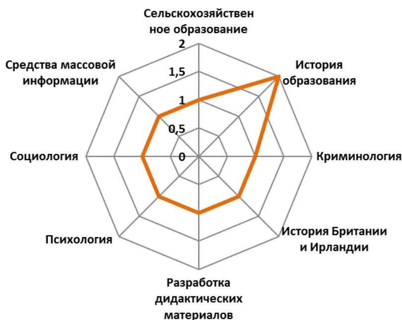
Рисунок 2. Тематическое распределение британских исследований в 80-е годы XX века (составлено авторами по данным ProQuest, http://www.proquest.com/products-services/pqdtglobal.html )

Второй этап исследования имеет своей задачей выявление распределений по предметной тематике, характеризующей совокупный исследовательский массив в ProQuest Dissertations and Theses по проблемам информального образования . На основе анализа тематики были выделены различные тематические кластеры и просчитано количество диссертаций, посвященных различной тематике. В эмпирический массив входили только диссертации, защищенные в Великобритании, в названии которых имеется категория анализа. Результаты, охватывающие период восьмидесятых годов, представлены на рисунке 2.