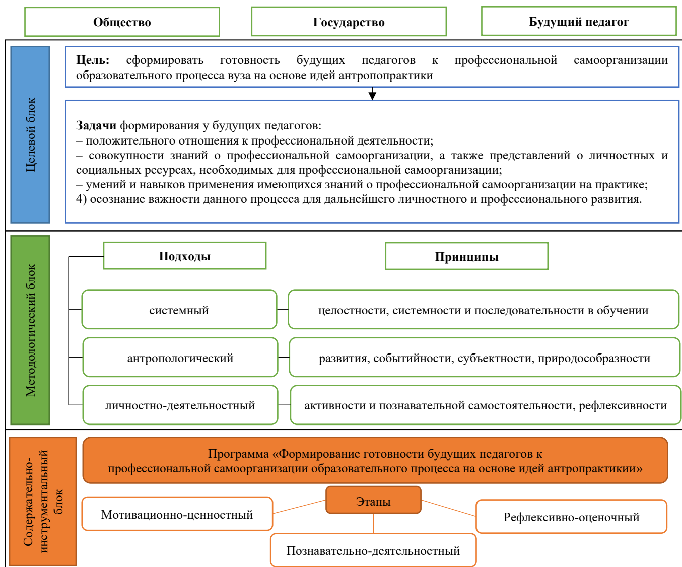
Рисунок 2. Модель формирования готовности будущих педагогов к профессиональной самоорганизации в образовательном процессе вуза на основе идей антропопрактики (составлено автором)

Ещё одним подходом, положенным в основу нашей модели является личностно-деятельностный (интегральный) подход , предлагающий рассматривать «самоорганизацию» как процесс, что напрямую связывает её с антропопрактикой, т. к. в основе последней лежит деятельность. Образовательная деятельность строится с учетом того, что будущие педагоги являются активными участниками целенаправленной деятельности, в результате которой достигаются личностно-значимые и профессиональные результаты. Основные принципы: активности и познавательной самостоятельности, рефлексивности.