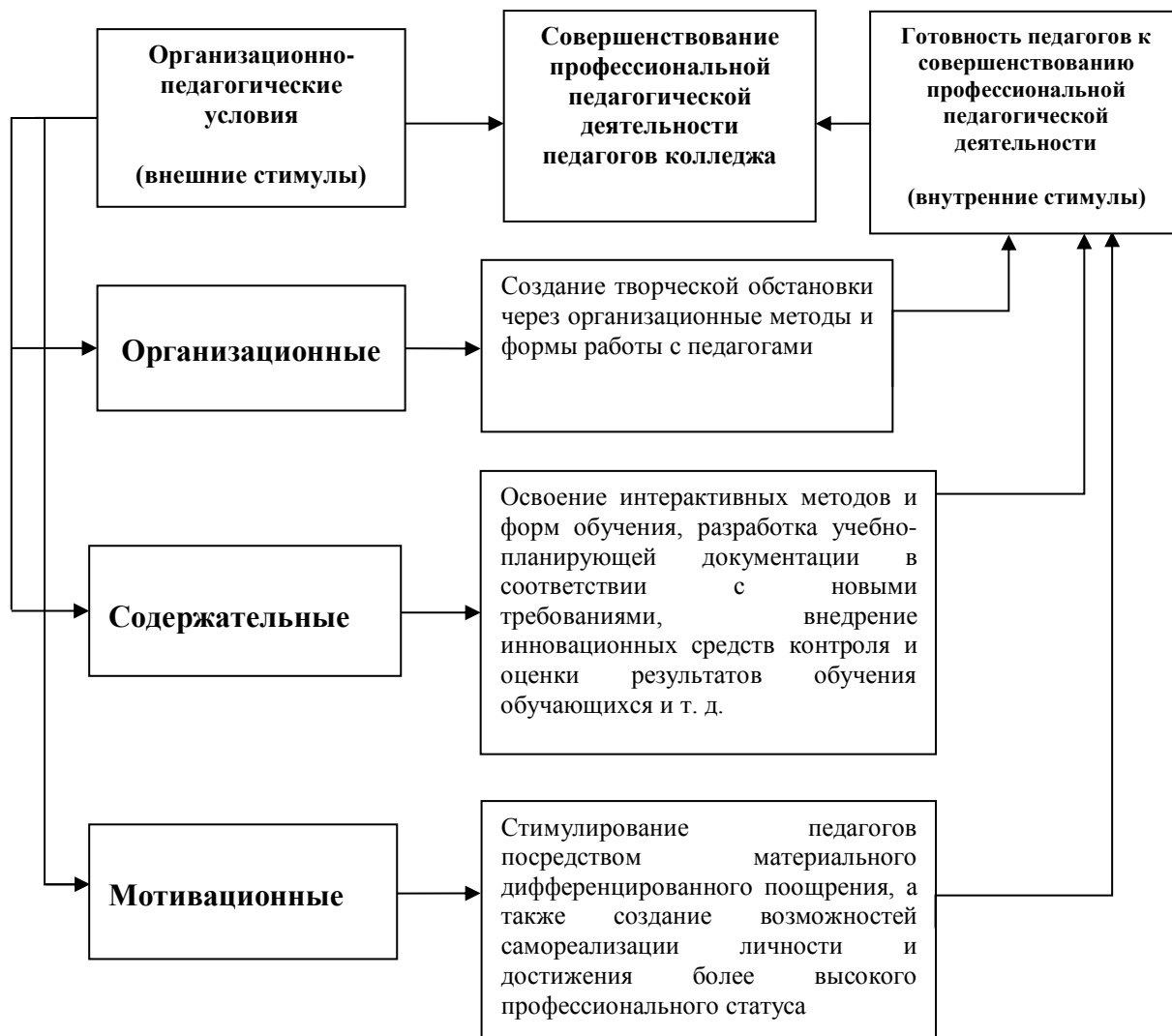
Рисунок 1. Взаимосвязь внешних и внутренних стимулов, влияющих на процесс совершенствования профессиональной педагогической деятельности педагогов колледжа (составлена авторами)

Именно готовность педагогов к совершенствованию профессиональной педагогической деятельности педагогов колледжа является внутренним стимулом проявления профессиональной активности педагогов.