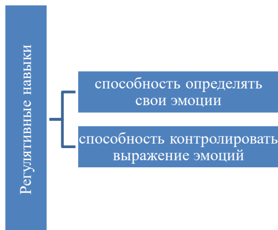
Рисунок 5. Структура регулятивных навыков (разработано автором)

обращает внимание на внутреннюю и межличностную направленность эмоционального интеллекта. Регуляция собственных эмоциональных состояний — это способность определить свои эмоции и контролировать их выражение (рис. 5).