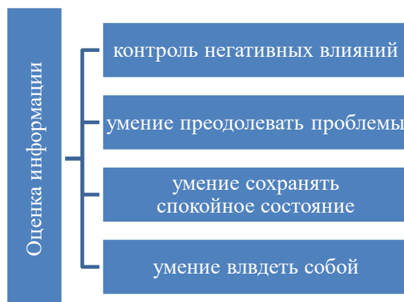
Рисунок 6. Структура оценки информации (разработано автором)

новых устремлений и их продуктивной реализации оказаться смущенным со стороны, без замкнутости, без страха быть отвергнутым [17].