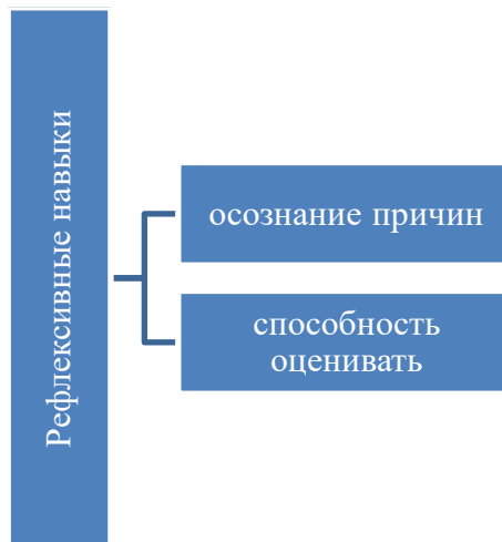
Рисунок 3. Структура рефлексивных навыков (разработано автором)

контролировать свои эмоции является важным достижением старшего дошкольного возраста, поскольку эмоциональная жизнь является центральной психической функцией дошкольника и в конце дошкольного периода становится произвольной. Непонимание собственных эмоций и эмоций окружающих, некорректное восприятие реакций окружающих и неумение контролировать свои эмоции при принятии решений могут привести к деструктивному поведению и социальной дезадаптации. Последние исследования показывают, что успех человека зависит лишь на 20 процентов от интеллектуальных способностей, в то время как около 80 процентов зависит от эмоционального развития [16]. Эмоциональный интеллект, один из когнитивных навыков, включает способность осознавать как свои собственные, так и эмоциональные состояния окружающих. Рефлексивные навыки включают в себя знание причин своих действий и эмоциональных состояний, а также способность оценивать мотивы и поведение других людей (рис. 3).