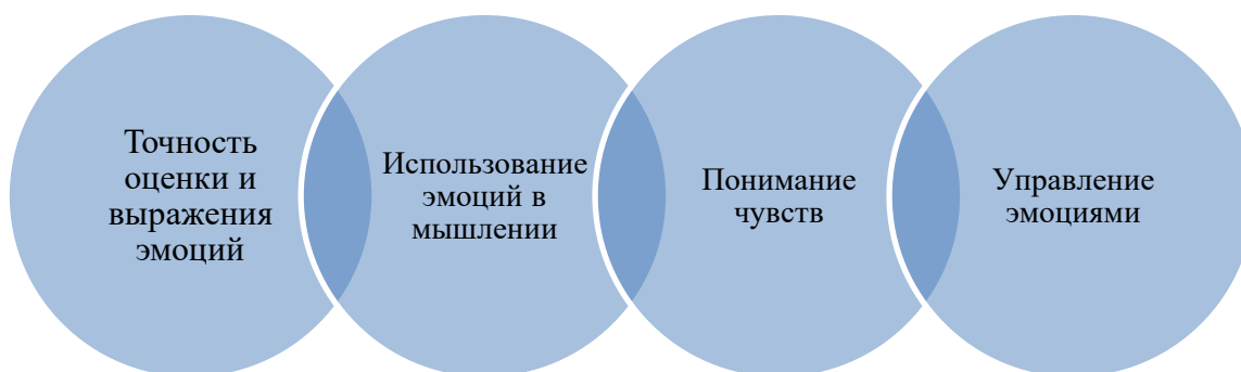
Рисунок 1. Модель эмоционального интеллекта Дж. Майера и П. Сэловей [11]

Разнообразные индивидуальные подходы к изучению вопросов интеллекта нашли объяснение в работах ведущих зарубежных психологов Г. Айзенка [1], Р. Кеттела [2], Ж. Пиаже [3], Ч. Спирмен [4], и др. В отечественной психологии XX века исследованиями интеллекта в различных направлениях занимались ученые: Б. Теплов [5], В. Небылицын [6], А. Тихомиров [7], М. Холодная [8]. Вопросы развития интеллекта детей изучали В.В. Абраменкова 1 , Е.И. Изотова [9]. Западные ученые, работавшие над концепцией эмоционального интеллекта: Д. Гоулмен [10], П. Сэловей [11], Дж. Мэйер [11], Д. Карузо [11], Р. Бар-Он [12]. Модель эмоционального интеллекта, представленная в работах Дж. Майера и П. Сэловей [11], является фундаментальной для определения данного понятия. Ее компоненты включают в себя четыре основных аспекта (рис. 1).