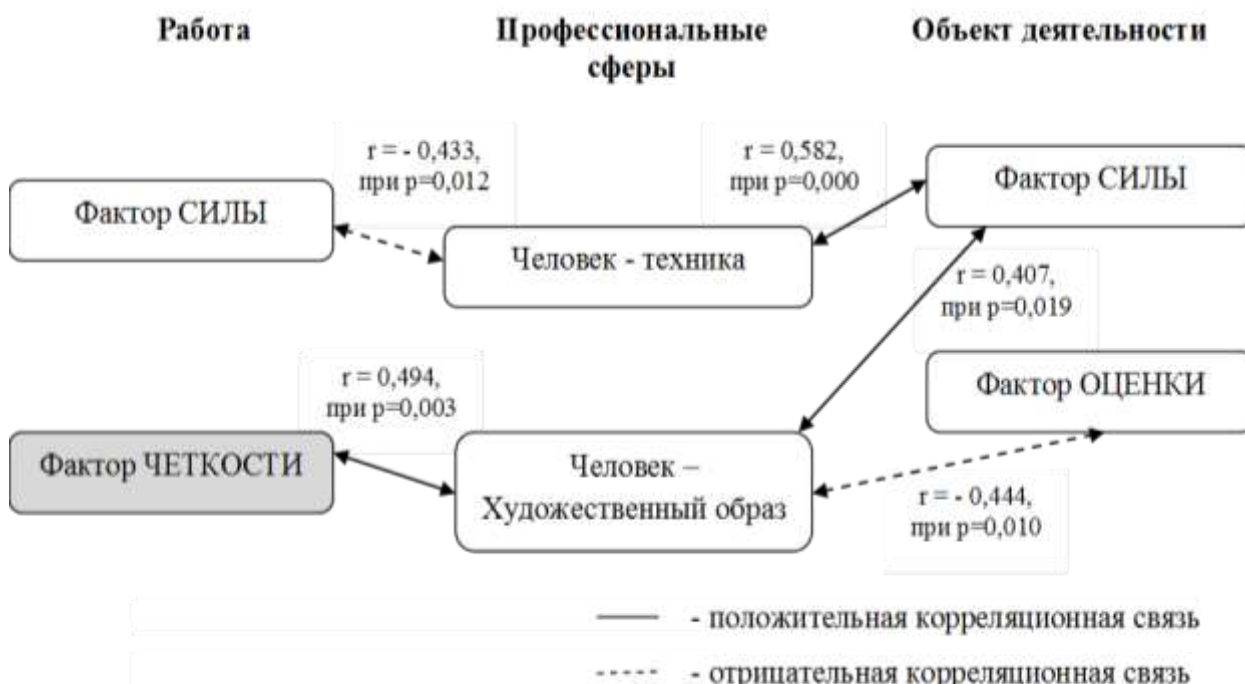
Рисунок 1. Корреляционная плеяда профессионального самоопределения и профессиональных представлений подростков-девочек с андрогинным типом гендерной идентичности (разработано автором)

На схеме 1 представлены значимые корреляционные связи профессионального самоопределения и профессиональных представлений подростков-девочек с андрогинным типом гендерной идентичности. Так девочки с андрогинным типом гендерной идентичности с интересами в профессиональной сфере Человек-Техника склонны оценивать объект деятельности ( r = 0,582 , при p = 0,000 ) как волевой. Так как особенностью технических (и неживых природных) объектов состоит в том, что они, как правило, могут быть точно измерены, определены по многим признакам и при их обработке, преобразовании, перемещении или оценке от работника требуется точность, определенность действий, то это свидетельствует об уверенности, независимости, склонности рассчитывать на собственные силы в трудных ситуациях, связанных с объектом, данных девочек-подростков.