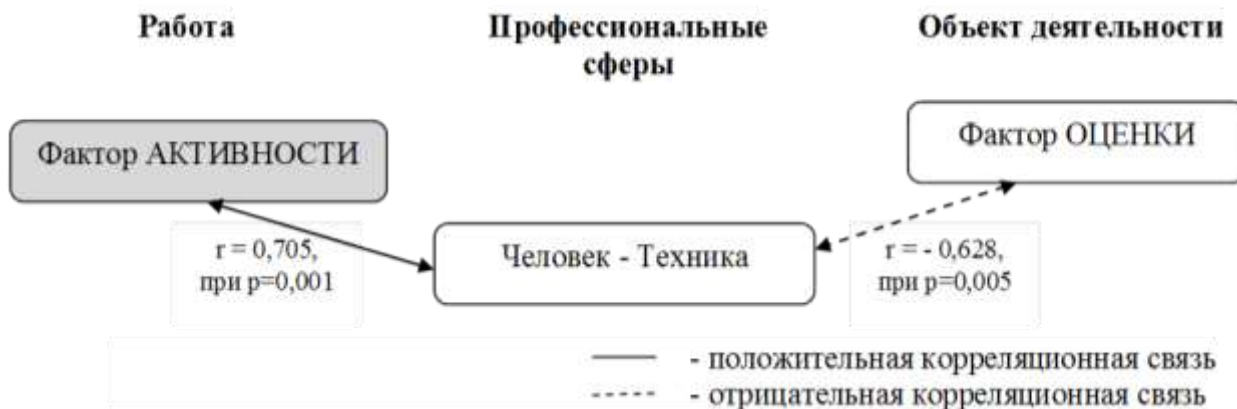
Рисунок 3. Корреляционная плеяда профессионального самоопределения и профессиональных представлений подростков-мальчиков с маскулинным типом гендерной идентичности (разработано автором)

На схеме 3 представлены значимые корреляционные связи профессионального самоопределения и профессиональных представлений подростков-мальчиков с маскулинным типом гендерной идентичности. Так интересы в профессиональной сфере Человек-Техника взаимосвязаны с фактором оценки и фактором активности. Объектами деятельности в данной профессиональной сфере выступают машины, механизмы, материалы, виды энергии, ткани, пластмассы, пищевое сырье, полуфабрикаты и т.д. и респонденты данной группы оценивают их как печальные и противные, где r = -0,628 , при p = 0,005 . Для них эти объекты представляют малую ценность.