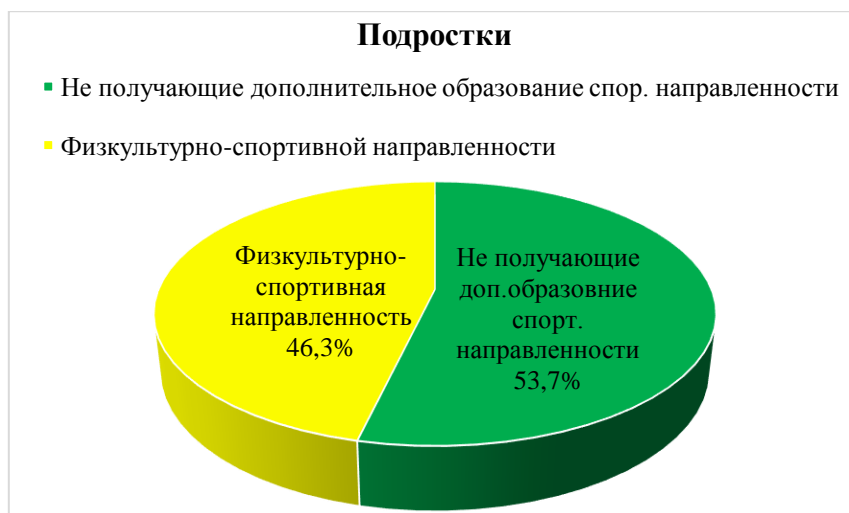
Рисунок 1. Результаты анкетирования подростков, с целью выявления факта получения образования спортивной направленности

Данные, полученные в результате проведения анкетирования, направленного на выявление факта включения подростков в систему дополнительного образования спортивной направленности, представлены на рисунке 1.