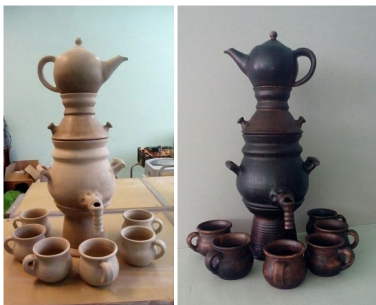
Рисунок 6. Русяев А.П. Этапы создания авторской работы «Чайный набор». Керамика, лощение, молочение (разработано автором)

Каждый элемент изготавливается на гончарном круге отдельно. При этом надо учитывать, что в процессе сушки и утильного обжига оно дает усадку. А при собирании композиции в единый ансамбль размеры каждого из них должны идеально подходить друг к другу (рисунок 6). В качестве декора применялись «лощение» и «молочение» (молочный обжиг) – традиционные способы декорирования народной глиняной посуды.