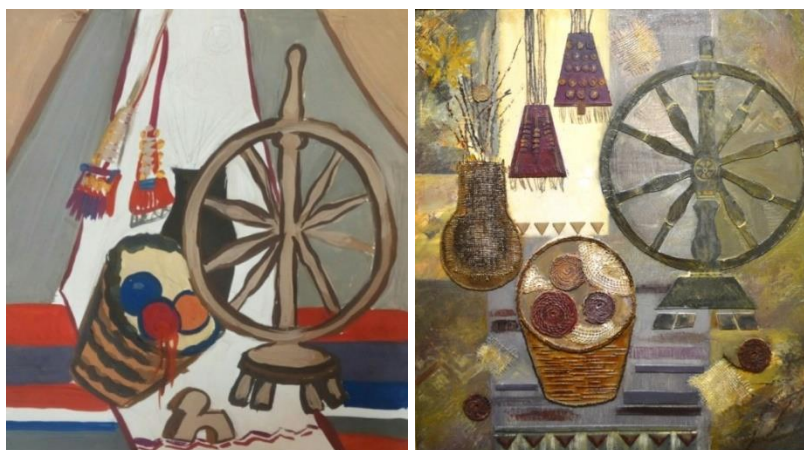
Рисунок 2. Князева Наталья.

Самой сложной задачей было создание эскиза на основе реального натюрморта. Следуя основному принципу коллажа (упрощение форм и отказ от излишней детализации), было ограничено количество предметов в натюрморте, композиционным центром которого выступила прялка (рисунок 2). В этой работе решались не только поиски творческой идеи, которую можно выразить наиболее адекватно средствами коллажа, но и фактурные и колористические задачи. Одной из главных задач в работе – это ее фактурная составляющая. На каждый фрагмент панно был выбран имитирующий материал. Поэтапно, составляя каждый элемент и добавляя детали, выстраивалась общая картина.