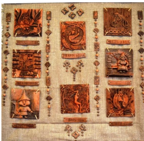
Рисунок 5. Разумовская Екатерина.

Специфика керамики определяется особенностями и свойствами материалов, которые позволяют получать в качестве конечного продукта – прочный, водостойкий и устойчивый к высоким температурам материал. Кроме того, данный вид декоративно-прикладного искусства «отличается разнообразием техник и приемов обработки материала» [9, с. 130]. В качестве яркого примера воплощения художественного образа средствами керамики, можно представить керамическое панно, под названием «Мифологические образы мордвы». Рассматривая данную работу, мы видим композицию из серии керамических рельефных элементов, каждый из которых служит единому художественному замыслу и отражает взаимосвязь различных сфер человеческого бытия и природы на основе образов героев мордовской мифологии (рисунок 5).