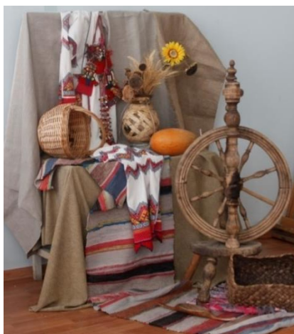
Рисунок 1. Натурная постановка (разработано авторами)

Рассмотрим этапы создания художественного образа и особенности его художественно-технологического воплощения на примере изготовления панно «Натюрморт с прялкой» в технике коллаж. В качестве источника творческого замысла стал один из ведущих образов культуры мордовского этноса, в котором одним из главных ее символов является образ дома, очаг, взаимосвязанный с образом хранительницы очага – хозяйкой дома – «куд ава» (куд – по мордовски дом, ава – хозяйка). Задуманный образный строй работы предполагал обращение к символическому решению и отказу от реалистической передачи форм. Это условие соответствовало выразительным возможностям коллажа, художественный язык которого предполагает условное изображение и активное обобщение формы. Для воплощения замысла была организована натурная постановка (рисунок 1).