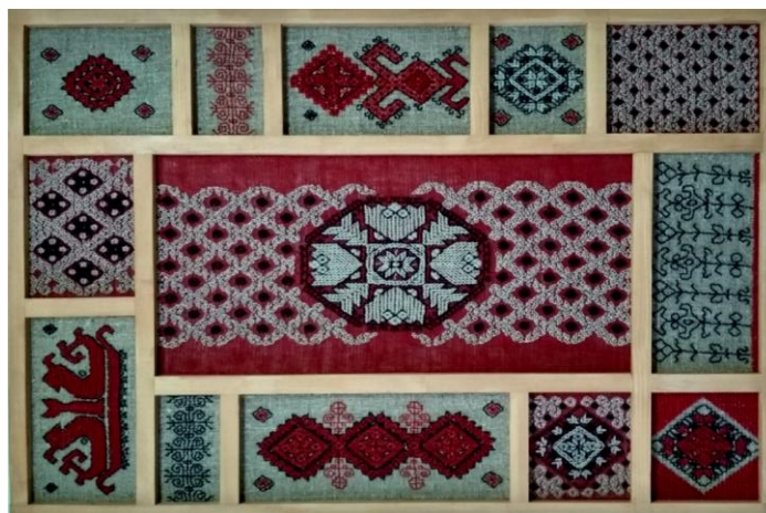
Рисунок 4. Данилина Кристина.

Такое решение гармонирует с тоном дерева и придает всей работе налет древней старины. Вышивка намеренно выполнена крупно и объемно. Орнаментальные мотивы развиты из традиционного элемента эрзянской вышивки «мордовской звездочки» и представляют собой геометризированные растительные, зооморфные образы (рисунок 4).