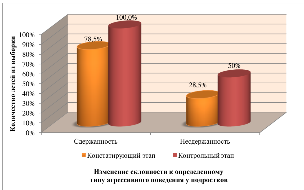
Рисунок 2. Сравнительный анализ результатов исследования по методике «Агрессивное поведение» (Е.П. Ильин, П.А. Ковалев) на констатирующем и контрольном этапах (составлено авторами)

Сравнительный анализ результатов, полученных с помощью методики «Оценка агрессивности в отношениях» (А. Ассингер) представим в таблице 3.