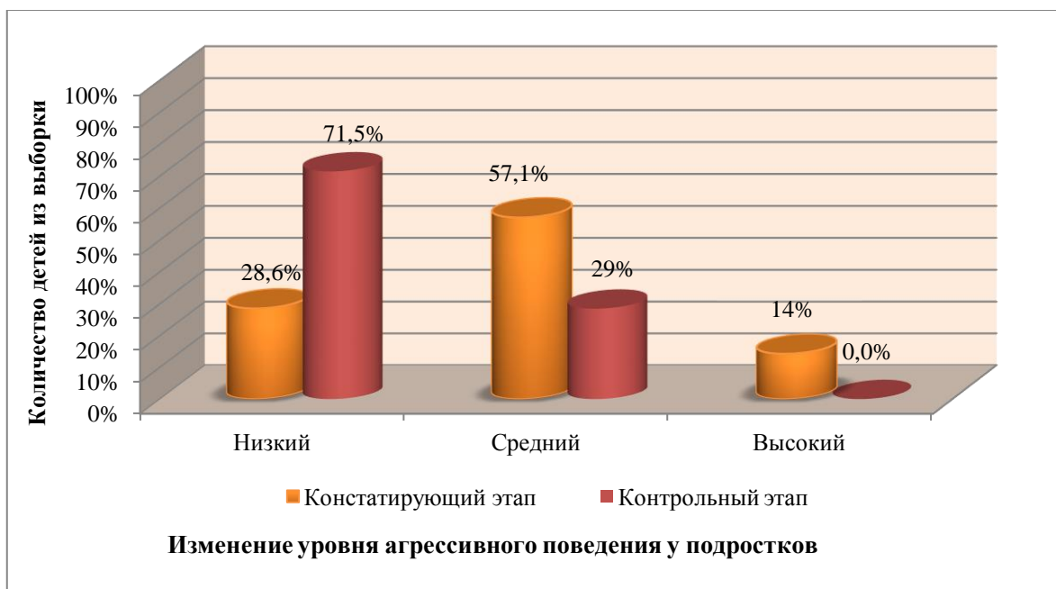
Рисунок 1. Сравнительный анализ результатов исследования по методике «Тест агрессивности» (Опросник Л.Г. Почебут) на констатирующем и контрольном этапах (составлено авторами)