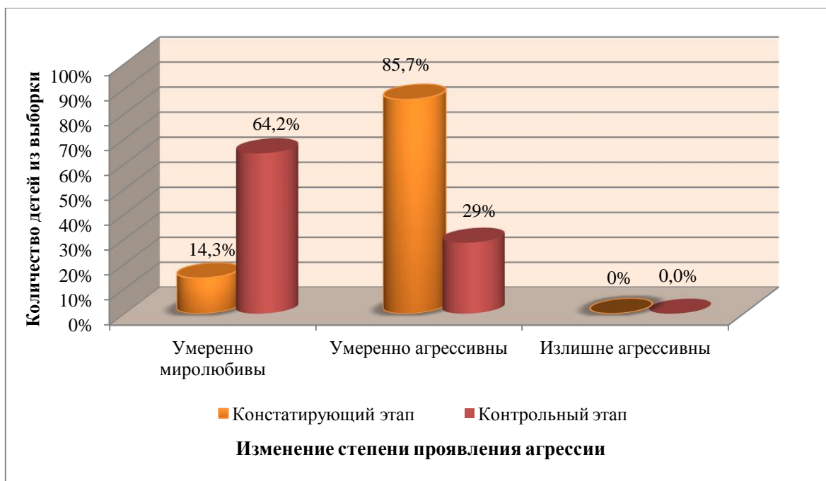
Рисунок 3. Сравнительный анализ результатов исследования по методике «Оценка агрессивности в отношениях» (А. Ассингер) на констатирующем и контрольном этапах (составлено авторами)

Из рисунка 3 видно, что в целом, в выборке у большинства подростков уровень агрессивного поведения стал ниже, отмечено более конструктивное поведение. подростки со сверстниками.