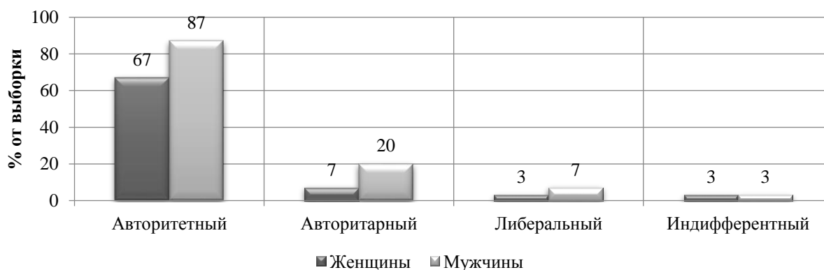
Рисунок 3. Сравнительная диаграмма преобладающих стратегий семейного воспитания отцов и матерей (составлено автором)

В ходе проведения исследования на определение ведущего (доминирующего) стиля воспитания среди матерей и отцов, были получены следующие результаты (рис. 3):