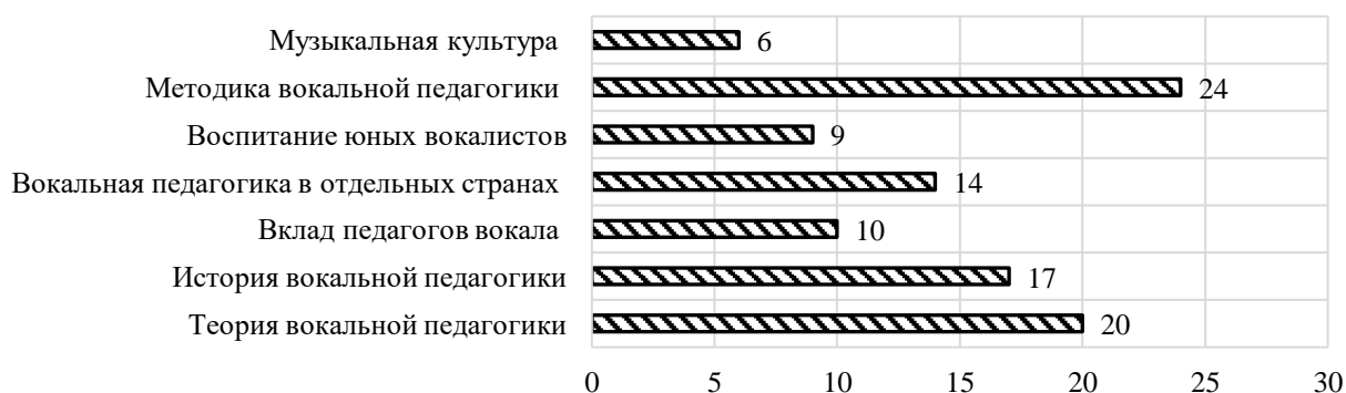
Рисунок 1. Распределение тематических публикаций, представленных в ресурсе РИНЦ, по кластерам (составлено авторами)

Первый этап исследования. Задачей первого этапа исследований является определение содержания тематических кластеров, посвященных вокальной педагогике, и их краткая характеристика в соответствии с критерием «объем публикаций в кластере». Исследование тематического содержания библиографической информации в базе ресурса РИНЦ проводилось на основе использования встроенной системы поиска. Публикационная активность авторов исследовалась на основании анализа содержания первых ста источников, которые были определены в перечне всех тематических публикаций. По содержанию публикаций (согласно их названиям) тематика была распределена по семи кластерам. Результаты представлены на рисунке 1.