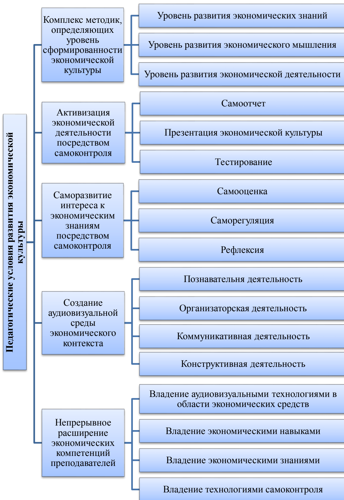
Рисунок 1. Педагогические условия формирования экономической культуры кадетов посредством развития самоконтроля и аудиовизуальных технологий кадетов морского вуза (составлено автором)