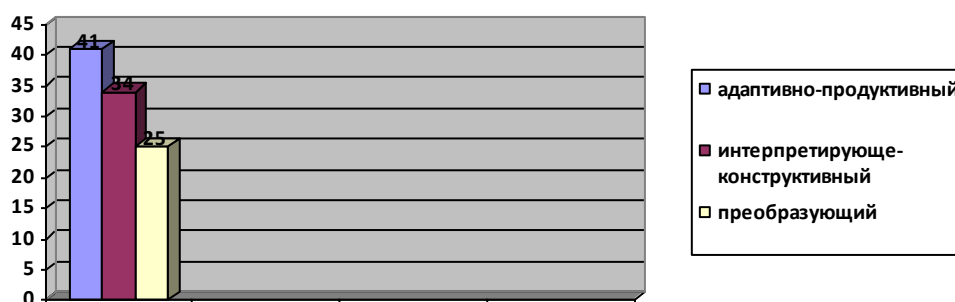
Рисунок 1. Результаты констатирующего этапа исследования по изучению уровня сформированности социально-экологических ценностей у будущих педагогов (составлено авторами)

Ответы еще 39 % респондентов характеризовались ценностным отношением к будущей профессиональной деятельности и осознанием ценности социально-экологического образования, воспитания и просвещения всех субъектов образовательного процесса. Студенты осознают значимость и необходимость проводимой в образовательных организациях работы, но не считают это приоритетным направлением в деятельности педагога (28 %). Суммируя полученные данные, мы получили следующие результаты: к адаптивно-репродуктивному уровню были отнесены 41 % респондентов, к интерпретирующе-конструктивному — 34 % и к преобразующему — 25 % будущих педагогов. Графически полученные результаты представлены на рисунке 1.