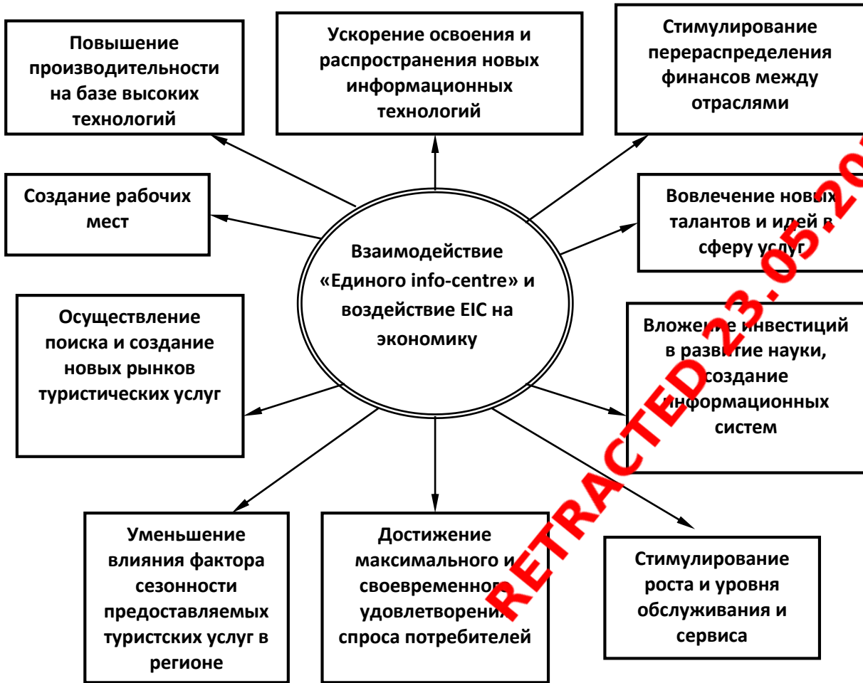
Рисунок 2. Структура воздействия ЕПИАЦ на экономику КБР