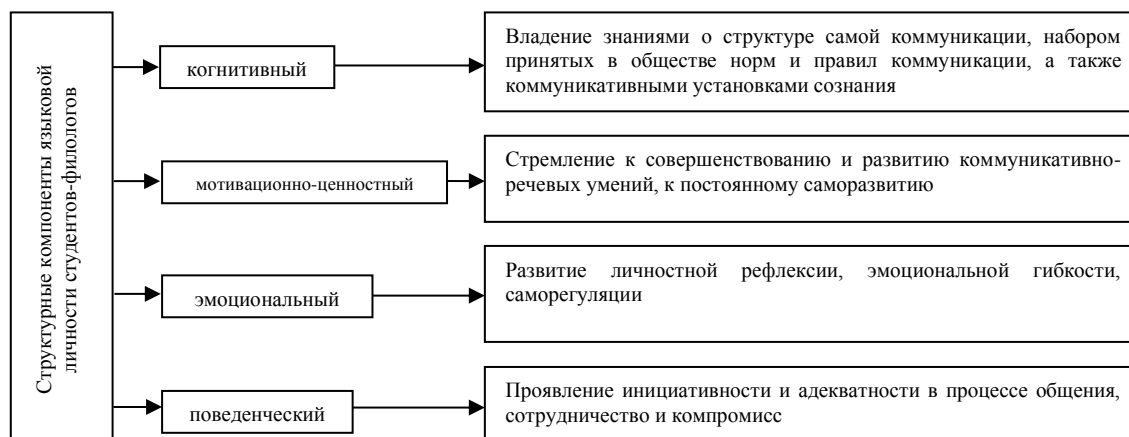
Рисунок 2. Структурные компоненты языковой личности студентов-филологов (составлено автором)

Также целевой блок модели ориентирован на развитие структурных компонентов языковой личности студентов-филологов: когнитивный, мотивационно-ценностный, эмоциональный, поведенческий (рис. 2).