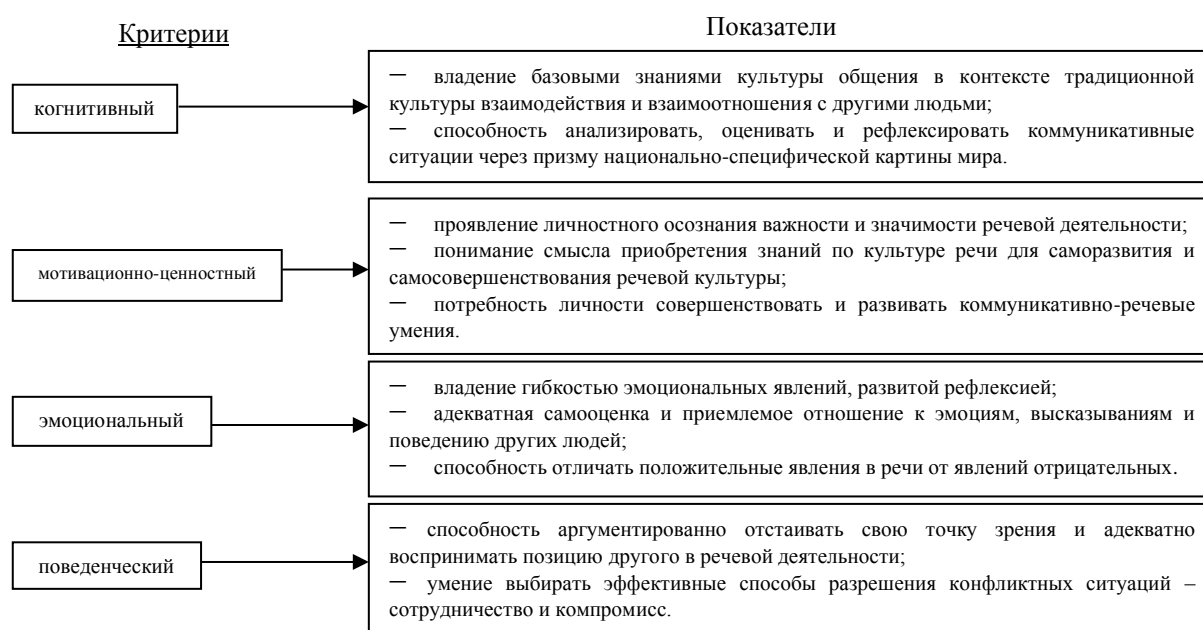
Рисунок 3. Критерии и показатели сформированности компонентов языковой личности студентов-филологов (составлено автором)

На основе предложенной нами структуры компонентов языковой личности студентов-филологов определены критерии и показатели сформированности компонентов языковой личности студентов-филологов (рис. 3).