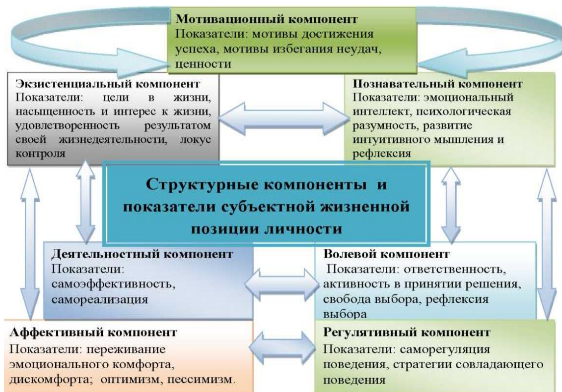
Рисунок 2. Структурные компоненты и показатели субъективной жизненной позиции как психологического конструкта (составлено автором)

Таким образом, предложенная теоретическая модель дает возможность утверждать, что психологический конструкт «субъективная жизненная позиция личности» не имеет строгого уровневого строения, но представляет собой систему, характеризующуюся наличием взаимосвязей между конструктивными компонентами.