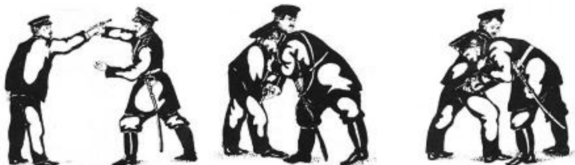
Рисунок 1. Самооборона при угрозе пистолетом спереди [7, с. 73]

Способы обезоруживания, описанные в 1902 году И.А. Смирновым, существенно отличаются от тех, которые представлены в современном Наставлении по физической подготовке для сотрудников УИС (НФП-2001). Так, вместо ухода с линии атаки рекомендовалось остановиться несколько левее нападающего и выставить вперёд левую ногу, парировать рекомендовалось одноимённой рукой захватом за кисть вооруженной руки противника с тыльной стороны и отведением её вправо, фиксировать – захватом за плечо с наружной стороны чуть выше локтя хватом большим пальцем кверху, нейтрализовать – болевым приёмом «Дожим кисти». Для выполнения «Дожима кисти» сотруднику рекомендовалось последовательно плотно упереться правым плечом в правое плечо нападающего, отвести вооруженную руку в сторону; удерживая вооружённую руку разноимённой рукой, одноимённой рукой перехватиться таким образом чтобы её большой палец оказался с внутренней стороны запястья нарушителя, а остальные пальцы – с тыльной стороны кисти; согнуть захваченную руку в локте за спину; согнуть кисть дальше направления естественного сгиба, вынудив противника ослабить хват и выронить оружие (рисунок 1).