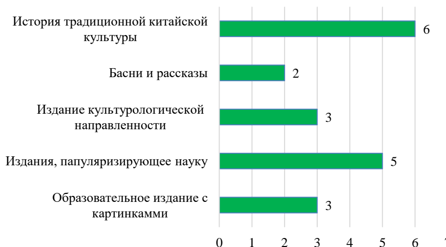
Рисунок 3. Результаты опроса респондентов по предпочтениям в выборе иллюстрированной литературы для совместного чтения с детьми (составлено авторами)

Как показано на рисунке, издания, популяризирующие науку, преобладают. Большое внимание уделено контенту, характеризующему культуру страны и образовательный вектор. Знакомство с данным тематическим блоком способствует формированию патриотических чувств.