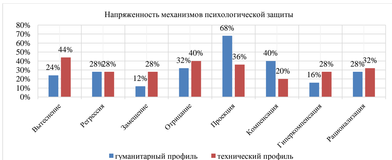
Рисунок 2. Распределение результатов выраженности психологических защит у студентов разного профиля обучения (составлено авторами)

У студентов технического профиля обучения доминирует более зрелая защита — вытеснение — 44 %. Более примитивные защиты: отрицание, выражено у 40 % и проекция у 36 % респондентов.