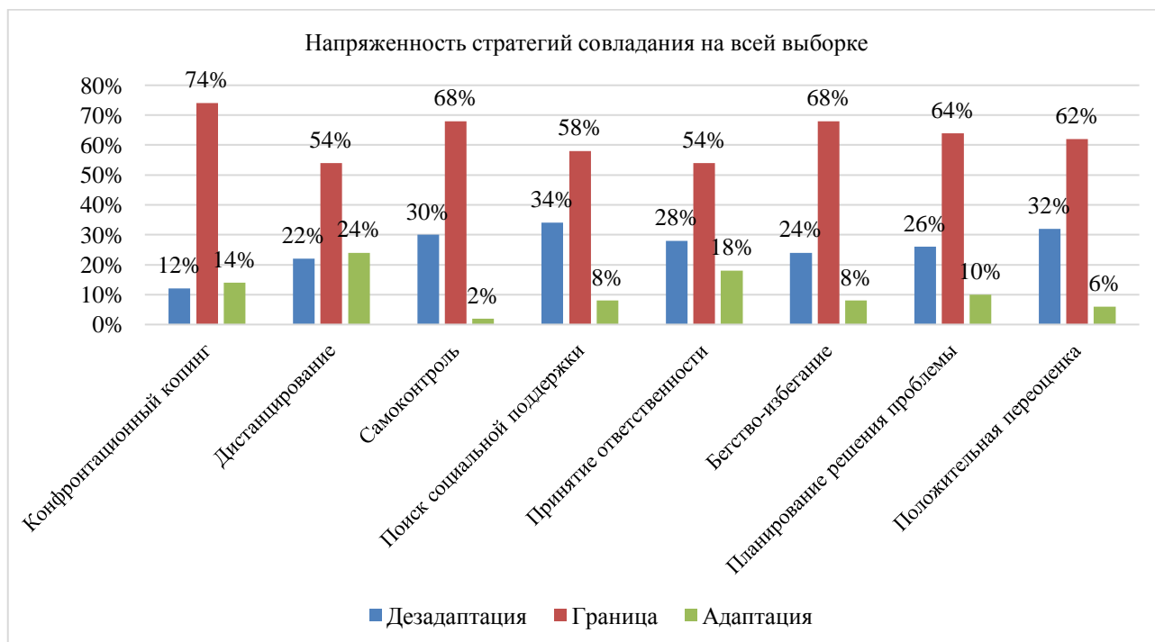
Рисунок 3. Распределение результатов стратегий совладания по всей выборке (составлено авторами)

Рассмотрим результаты исследования совладающего поведения студентов. Распределение результатов совладающего поведения всех студентов представлено на рисунке 3.