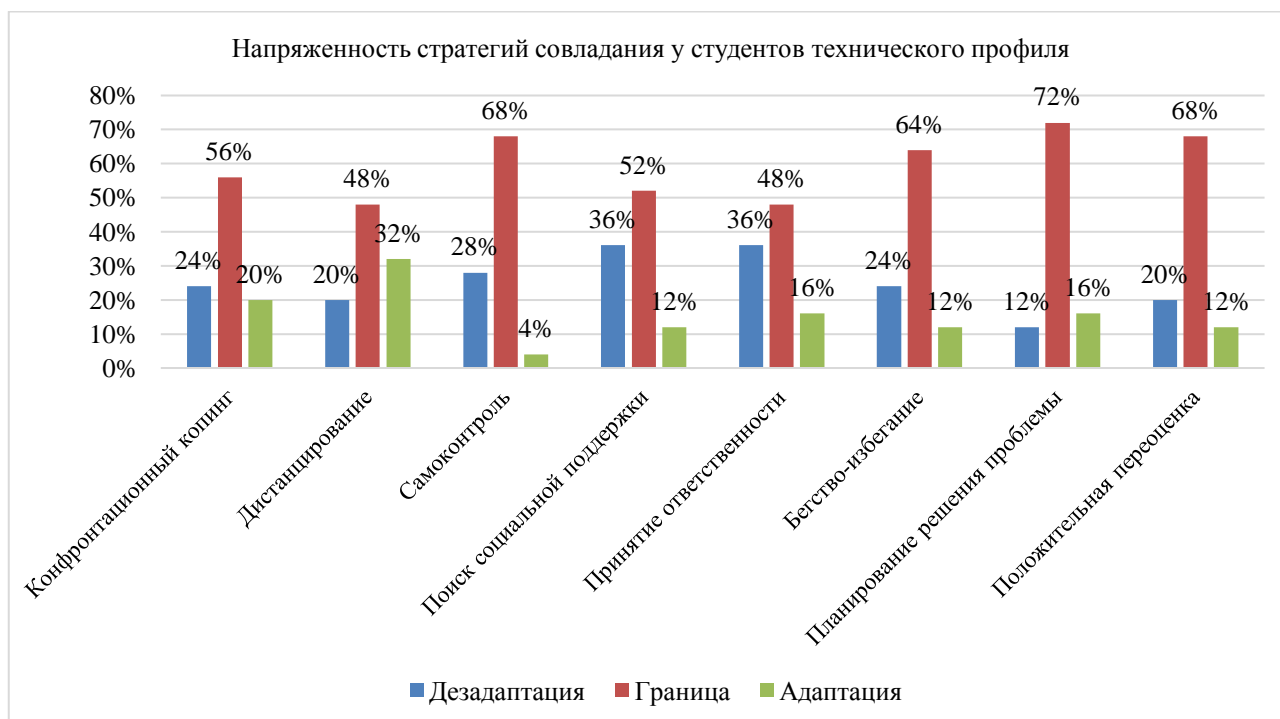
Рисунок 5. Результаты студентов технического профиля обучения (составлено авторами)

Сравнивая результаты обеих групп, можем сделать следующие выводы. К конфронтационному копингу в группе гуманитарного профиля обращаются 92 % респондентов, в группе технического профиля — 80 % респондентов, из них 24 % прибегают к копингу постоянно в отличие от студентов-гуманитариев.