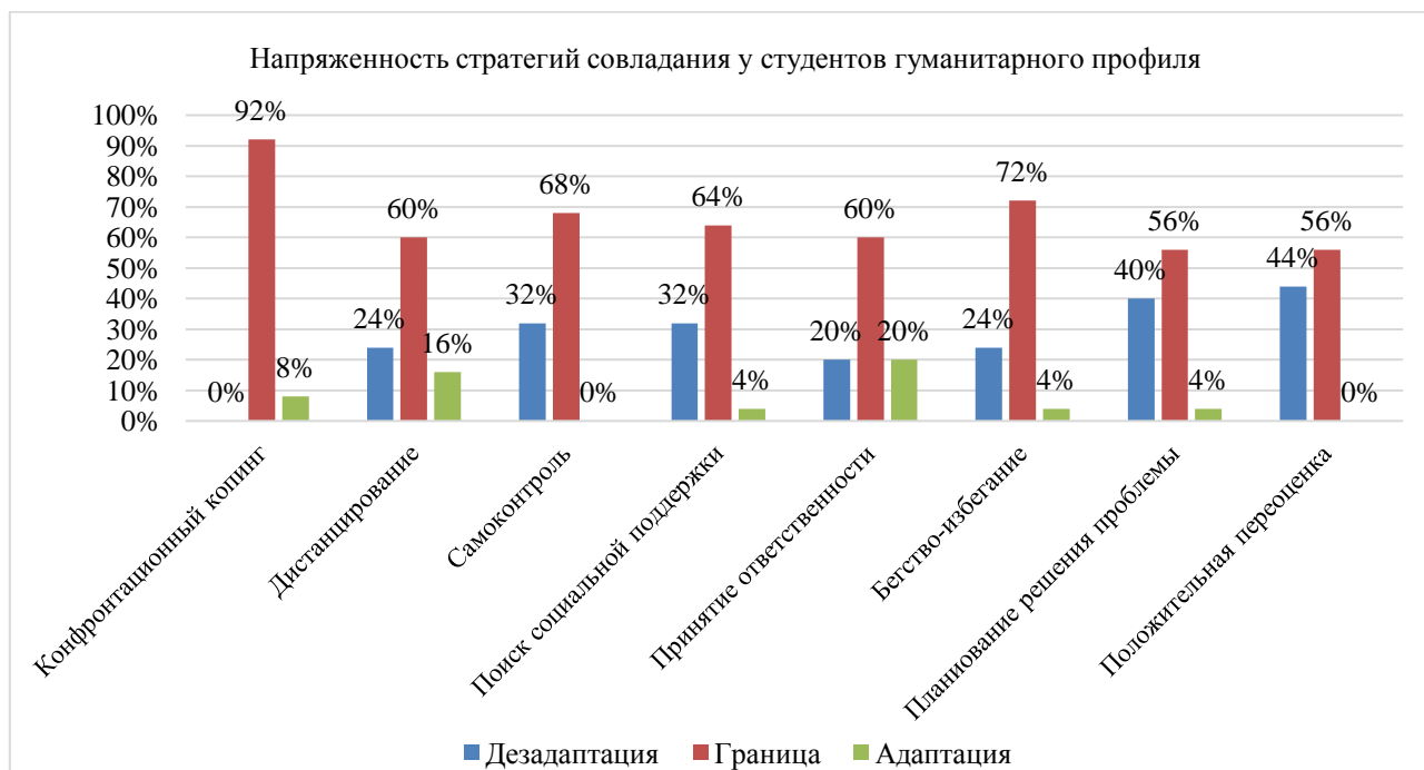
Рисунок 4. Результаты студентов гуманитарного профиля обучения (составлено авторами)

Остановимся на результатах диагностики стратегий совладания у студентов разного профиля обучения. Результаты представлены на рисунках 4 и 5.