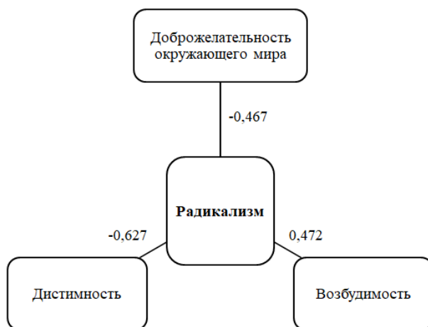
Рисунок 2. Взаимосвязи личностных качеств осужденных лиц (рисунок автора)

Выявлены отрицательные взаимосвязи показателя интеллекта (рис. 1) (фактор В по методике R.V. Cattell) с убеждением о доброжелательности мира и циклотивностью характера, а также положительные взаимосвязи с ценностью любви и чувством вины у осужденных лиц в колониях поселения. Возможно, осужденные лица с развитым абстрактным мышлением и обучаемостью, отрицают, что в мире больше положительных людей и событий, а также не склонны к резким переменам настроения, при этом для них важно построение близких интимных отношений и они испытывают высокое чувство вины, и наоборот. Это означает, что лица с высоким интеллектом в большей степени склонны к анализу окружающего мира и собственных поступков и склонны сохранять стабильный эмоциональный фон.