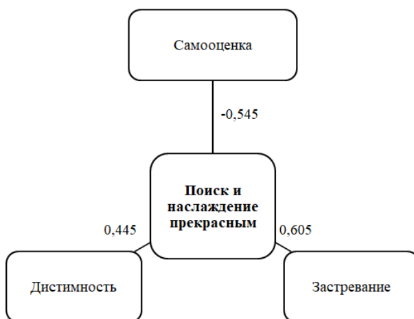
Рисунок 3. Взаимосвязи ценностей и личностных качеств осужденных лиц (рисунок автора)

Согласно данной плеяде (рис. 2), радикализм (фактор Q1) положительно связан с возбудимостью характера и отрицательно связан с дистимностью и убеждением о доброжелательности мира. Т.е. осужденные лица в колониях поселения, склонные к свободомыслию и восприимчивые к переменам, импульсивны и слабо контролируют собственные побуждения, не склонны к пессимизму и отрицают, что в мире больше положительных людей и событий. Это может свидетельствовать о том, что осужденные лица, открытые переменам и склонные к импульсивности имеют устойчивые представления о мире, в котором мало места доброжелательности, при этом собственные характерологические особенности, цели и ценности позволяют им сохранять активность и устойчивость настроения.