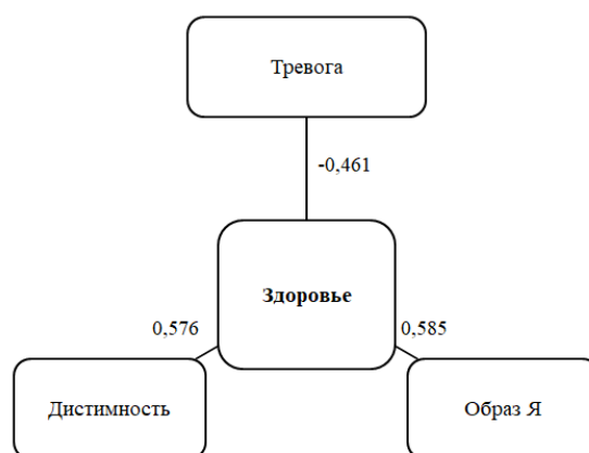
Рисунок 4. Взаимосвязи ценности здоровья и личностных качеств осужденных лиц (рисунок автора)

Ценность здоровья у осужденных лиц в колонии поселения (рис. 4) положительно связана с дистимностью и образом Я, а также отрицательно связана с уровнем тревоги (фактор F1). Осужденные лица, для которых важно заботиться о собственном здоровье и теле, в меньшей степени испытывают тревогу, у них наблюдается устойчивый и позитивный образ собственной личности и они фиксируются на теневых сторонах жизни.