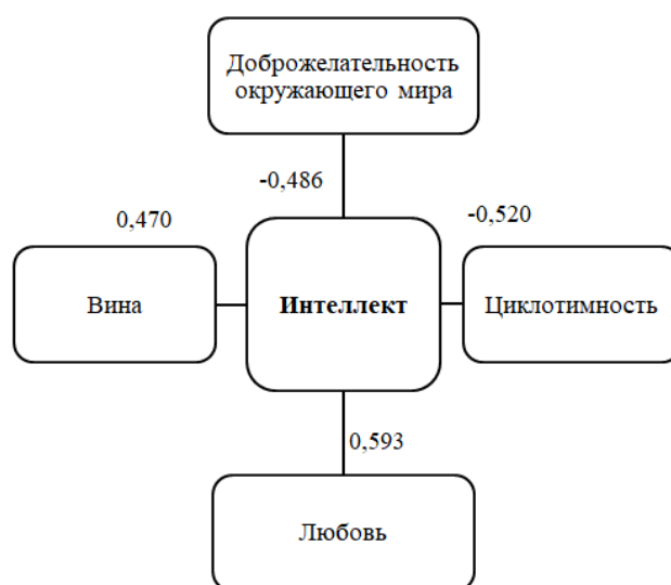
Рисунок 1. Взаимосвязи ценностей и личностных качеств осужденных лиц (рисунок автора)

Для исследования взаимосвязи ценностей и личностных качеств осужденных лиц в колониях поселения проведен корреляционный анализ при помощи статистического критерия r-Спирмена. По результатам статистической обработки выявлено множество достоверных взаимосвязей ценностных ориентаций, личностных черт, базисных убеждений и чувства вины. Рассмотрим наиболее значимые статистические взаимосвязи.