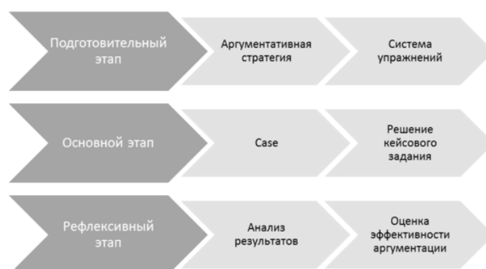
Рисунок 1. Технология обучения аргументативному высказыванию (составлено автором)

Опираясь на разработку В.П. Москвина 6 , который выделяет три этапа обучения аргументативному общению на английском языке, мы предлагаем следующую технологию обучения аргументативным стратегиям монологического высказывания (рис. 1). 7