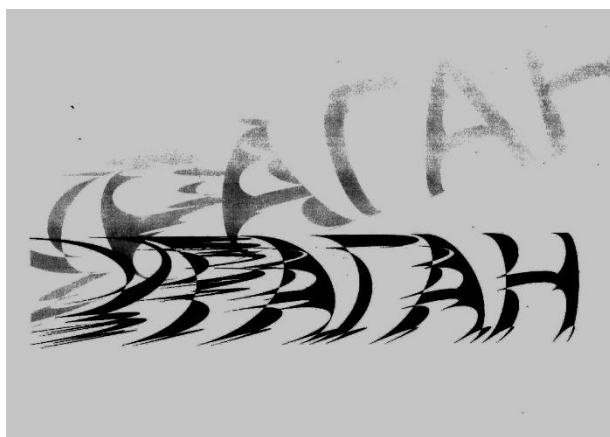
Рисунок 1. Ураган (учебная работа)

Примеры выполненных заданий можно увидеть на рисунках 1-3.