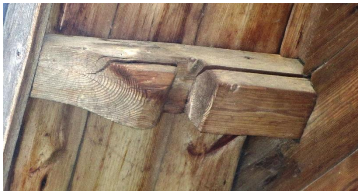
Рис. 7. Кобылка дома по ул. Комсомольской, 18

Для русского деревянного зодчества в принципе характерно декоративное выделение семантически значимых частей сооружений. Как правило, и выпуски бревенчатых консолей – помочи – получали некое оформление. Иногда торец бревна приобретал вовсе скульптурное воплощение, заставляя зрителя забыть о природе и происхождении брёвен сруба. История русского деревянного зодчества даёт неоднократные примеры декоративного оформления также выступающих концов слег самцовой кровли. Очевидно, опираясь на эту древнюю традицию, парфеньевские плотники украсили несложным профилем концы горизонтального бруса-затяжки, концы которого, выходя за внешнюю плоскость стены, поддерживают свесы крыши. Такие профилированные консоли обнаружены на домах: ул. Комсомольская, 18 (рис. 7), 22, также ул. Культуры, 18, ул. Советская, 21 (рис. 8) и некоторых других.