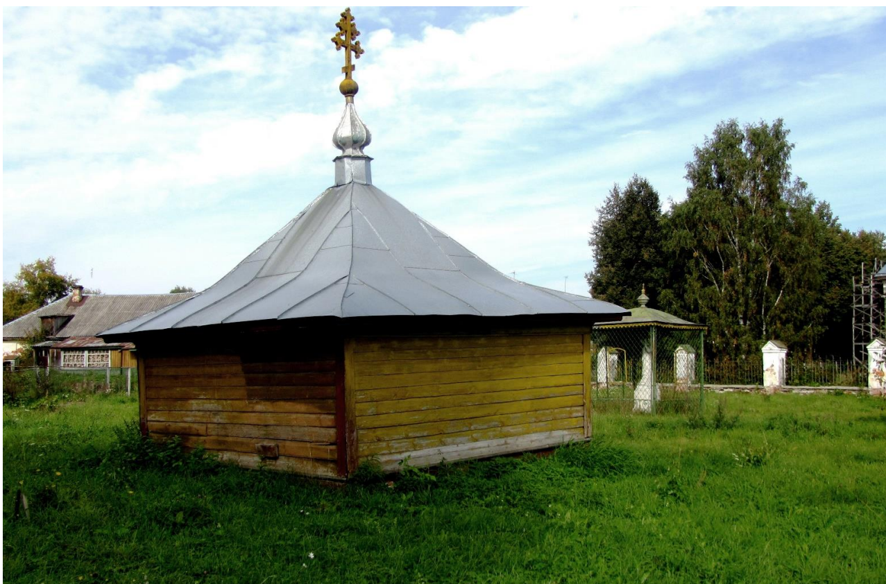
Рис. 9. Часовня на Соборной горе

Парфеньево – один из немногих сравнительно крупных населенных пунктов области, сохранивших в застройке действующий деревянный культовый объект. Часовня, расположенная в ограде Воскресенского собора, сооружена на рубеже XIX-XX веков (рис. 9). Часовня находится на территории кладбища, к северу от собора, и, следовательно, может быть надмогильным сооружением. Квадратный в плане сруб часовни обшит профилированным тесом. Стены глухие, лишь в западной стене прорублен невысокий дверной проем. Часовня накрыта четырехскатной крышей «колпаком» с полицами. Скромная по архитектуре часовня, принадлежащая к клетскому типу, характерна для Костромского региона.