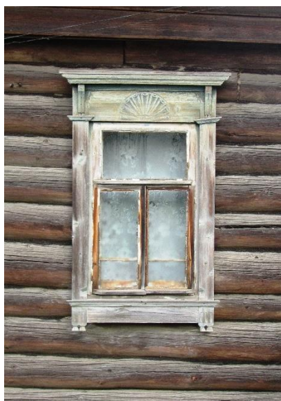
Рис. 4. Наличник (Пионерская, 23)

Вектор классицизма, заданный в пределах российской Империи в эпоху Екатерины II, долгое время влиял на застройку, в том числе и деревянную, Костромской губернии. На материалах городской деревянной застройки Костромы этот тезис убедительно доказал А. С. Кокшаров [4, с. 116-117]. В составе резного декора жилых домов Парфеньева разнообразные эклектичные композиции на основе позднего провинциального классицизма в технике пропильной и глухой резьбы. Среди многих декоративных элементов интересны часто встречающиеся в губернии, отчасти уже и в новом строительстве, круглые и ромбические веерные розетки. В экстерьере памятников деревянной жилой архитектуры розетки занимают различные позиции. Так, в оформлении веранды второго этажа жилого дома, расположенного по адресу: Нейский переулок, 8/12, розетки украшают фасадный шпигец. Стойки веранды, представляющие круглые колонки утрированного тосканского ордера на пьедесталах, ныне скрыты под блоками оконного остекления.