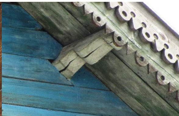
Рис. 8. Кобылка дома по ул. Советской, 21

На каждом скате ставились 2-4 бруса, включая коньковый. Важно, что такое решение повторяется и на боковых фасадах – кобылки, удерживающие нижний свес кровли, на всех без исключения вышеупомянутых домах, имеют профиль, аналогичный брусам главного фасада. Размещённые в чётком ритме, вторящие друг другу профилированными завершениями, затяжки создавали определённый настрой, являясь, по сути, совершенно утилитарными элементами конструкции. Схожесть декора, датировки (сооружение объектов относится к началу – 3-й четв. XX века) позволяет говорить о локальной архитектурно-строительной традиции, имеющей, к тому же, неширокий временной диапазон. Интересно, что смена типа крыши с самцовой (которая ещё встречается в Парфеньево на хозяйственных постройках и пристроенных хозяйственных дворах, очевидно перенесённых из окрестных деревень) на