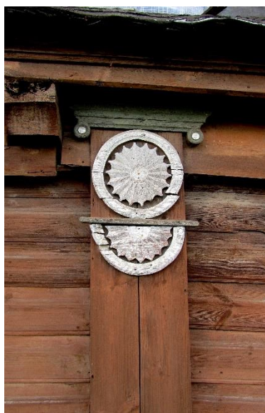
Рис. 5. Декоративная композиция (Пионерская, 22)