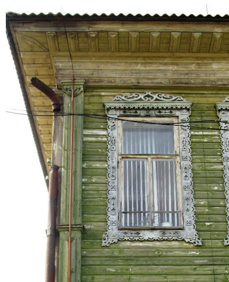
Рис. 6. Фасадный декор дома по ул. Белоруковых, 20/2

Но чаще веерные розетки украшают лопатки – декорированные перерубы и наличники окон домов. Полусолнца, выполненные в технике глухой резьбы, украшают дома на улицах Пионерская, 23 и Ленина, 21. Классицистический наличник, завершённый сандриком, покоящимся на паре широко расставленных кронштейнов, имеет восходящее полусолнце на поле высокого очелья (рис. 4). Сразу несколько домов Парфеньева, причём размещённые в разных частях села, имеют выделенные пилястры – декорированные приборны, в верхней части – условной капители – сходная для многих домов композиция из круглой веерной розетки и нижней половины такой же розетки под ней. В некоторых случаях резьба розетки усложняется, но, в общем, незначительно. Такой интересный местный мотив дополняет экстерьер домов,