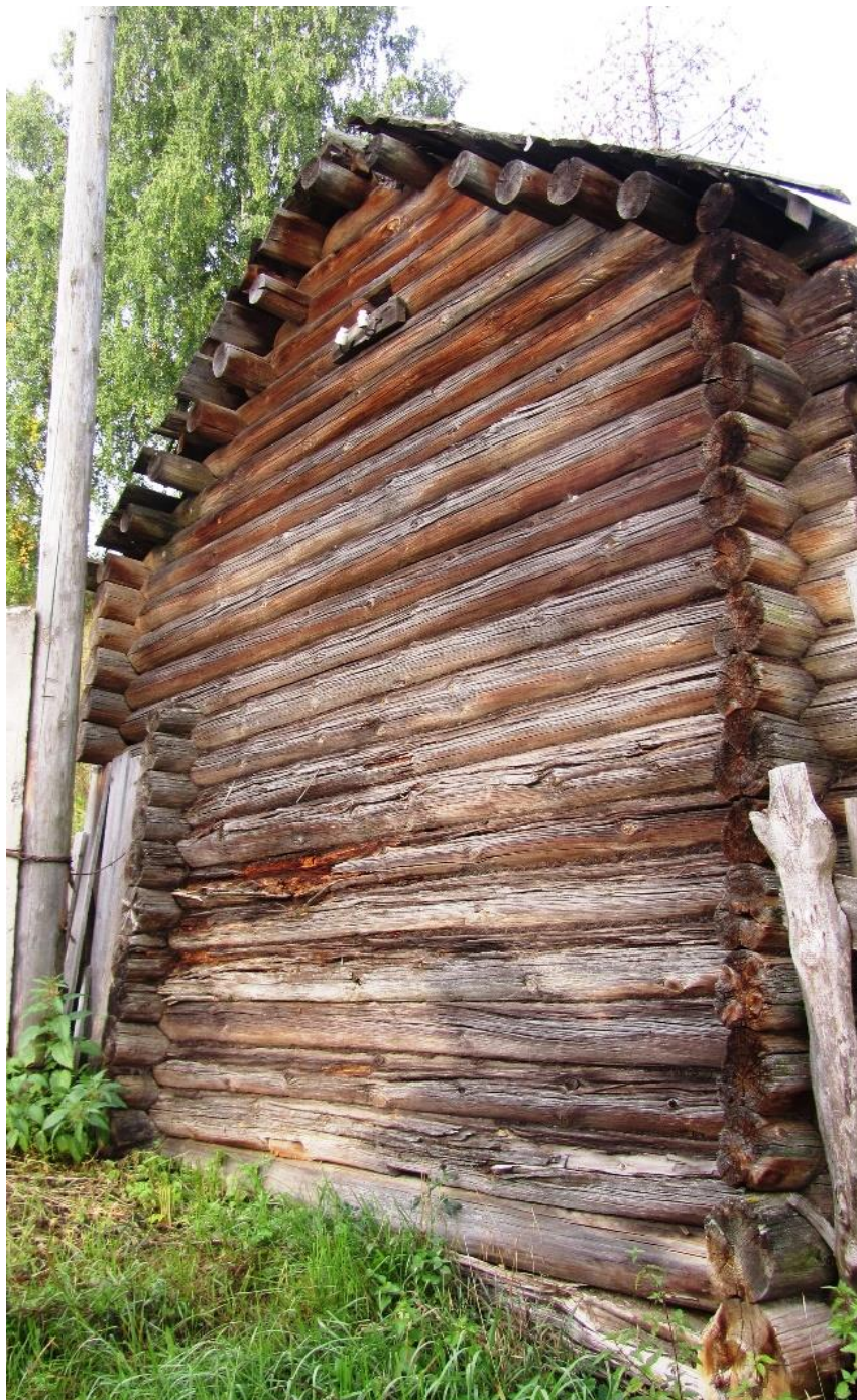
Рис. 2. Амбар (Комсомольская, 15). Вид юго-западной стены

тому же потребляющих электроэнергию. Оба амбара иллюстрируют пример несложной, на первый взгляд, но продуманной хозяйственной постройки.