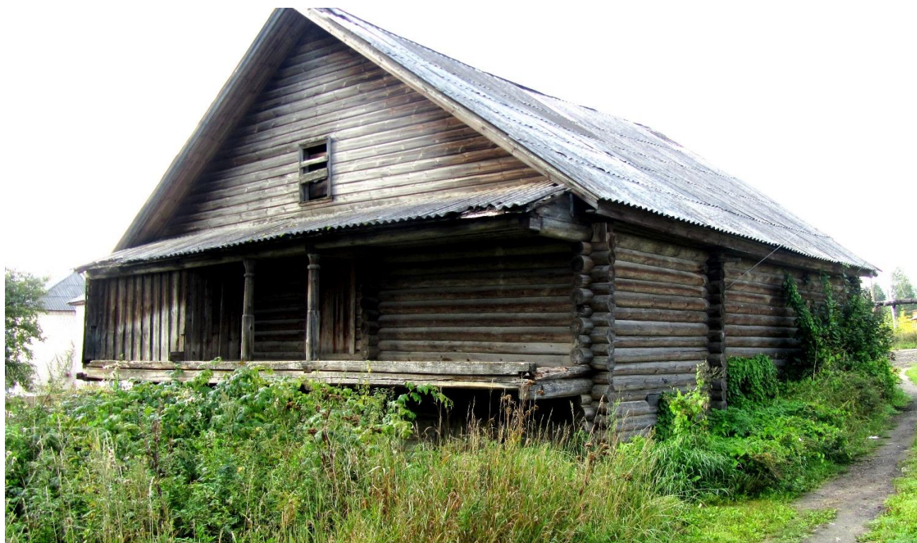
Рис. 3. Хозпостройка (Ленина, 48)