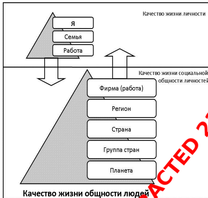
Рис. 1. К вопросу о понятийной основе качества жизни в зависимости от масштаба объекта

Современный мировой экономический кризис во многом показал сильнее зависимости КАЧЕСТВА ЖИЗНИ с состоянием мировой экономики. Значит, в процесс оценки качества жизни необходимо включить более широкий набор показателей. И первое, что необходимо сделать это в прямом и переносном смысле включить качество жизни конкретного человека во все социально-экономические процессы. В таком ракурсе КАЧЕСТВО ЖИЗНИ – наука, возвращающая человека в роль главного агента по развитию самого себя, общества, фирмы (организации), государства и всего человечества в целом.