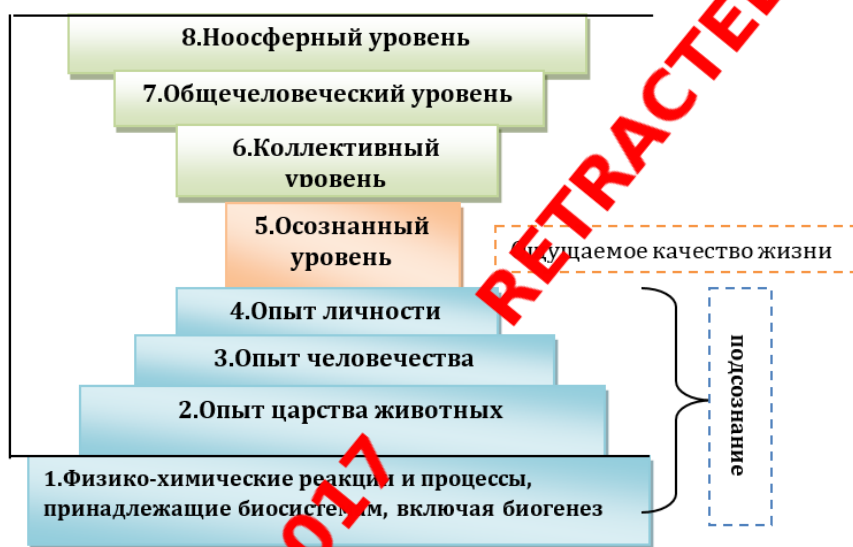
Рис. 5. Модель составляющих качества жизни субъекта труда (личности)

где P_1; P_2; \dots P_i; \dots P_n - соответственно первый, второй, ... i -й уровень и n -ый показатель качества жизни самовоспроизводящей системы.