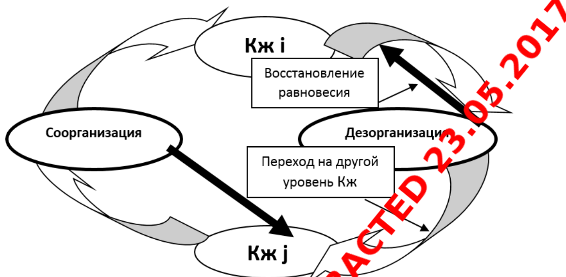
Рис. 3. Графическое представление процесса перехода из одного уровня качества жизни в другой.

Экспериментально доказано, что если суммарное дезорганизующее или соорганизующее воздействия не превышают 15%, то переход на другой уровень качества жизни не происходит. В случае большего суммарного воздействия происходит переход на другой уровень качества жизни Кж j.