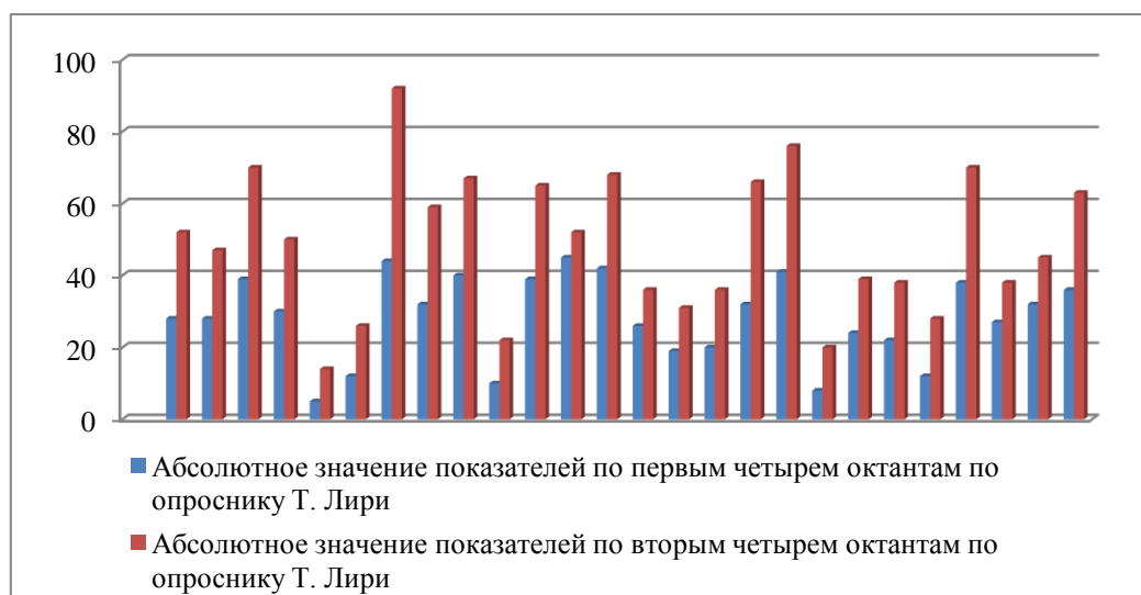
Рисунок 2. Проявление конформных и неконформных тенденций в межличностных отношениях у испытуемых, имеющих средний уровень развития рефлексии средствами Интернета (составлено автором)