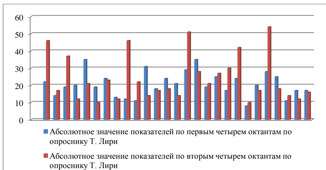
Рисунок 1. Проявление конформных и неконформных тенденций в межличностных отношениях у испытуемых с низким уровнем развития рефлексии средствами Интернета (составлено автором)

«авторитетный»; «независимо-доминирующий»; «агрессивный»; «недоверчивый-скептический»; «покорно-застенчивый»; «зависимый»; «сотрудничающий»; «альтруистический». Первые четыре типа межличностных отношений характеризуются преобладанием неконформных тенденций в поведении, вторые четыре – преобладанием конформных установок. При интерпретации данных необходимо больше ориентироваться на преобладание одних показателей над другими и в меньшей степени – на абсолютные величины. Анализируя, полученные данные, мы подсчитали абсолютные значения по каждому испытуемому по октантам (рисунки 1-3) и, соответственно, отнесли тех, у кого больше величина показателей по первым четырем октантам к типу, у которого преобладают неконформные тенденции в межличностных отношениях. Испытуемых, у которых больше величина показателей по вторым четырем октантам мы отнесли к типу, у которого преобладают конформистские установки.