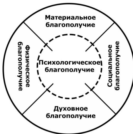
Рисунок 1. Структура субъективного благополучия

Центральной, основной составляющей в структуре субъективного благополучия является, на наш взгляд, психологическое благополучие. Психологическое благополучие является как самостоятельным структурным компонентом субъективного благополучия, так и частично интегрирующей в себя остальные составляющие субъективного благополучия, связывая их между собой. Место психологического благополучия в структуре субъективного благополучия представлено на рисунке 1.